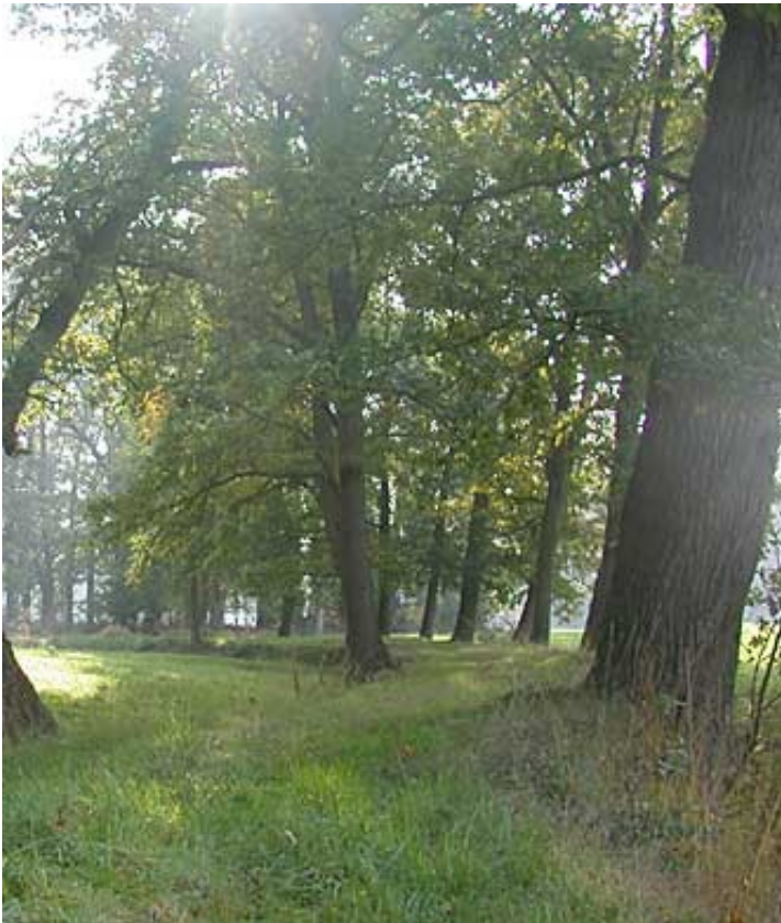
Resten van de landweer richting de voormalige havezate 't Graes.