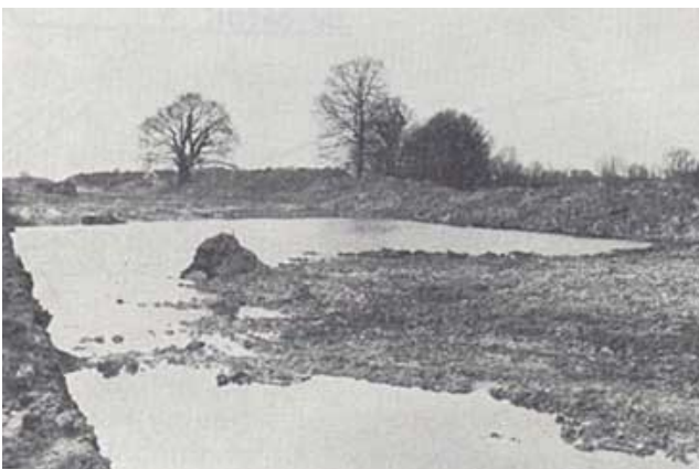
Resten van de oude molenkolk die tevoorschijn kwamen tijdens de aanleg van de A35/A1