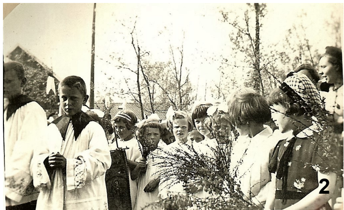
De kapel bij de inwijding in 1938.

OPROEP: De foto's zijn genummerd. Herkent u personen? Neem contact op met de redactie en geef aan wie u herkent op welke foto.