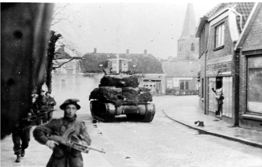
Soldaten van het Dorset regiment trekken onder bescherming van een Sherman tank van de Sherwood Rangers door de Grotestraat.