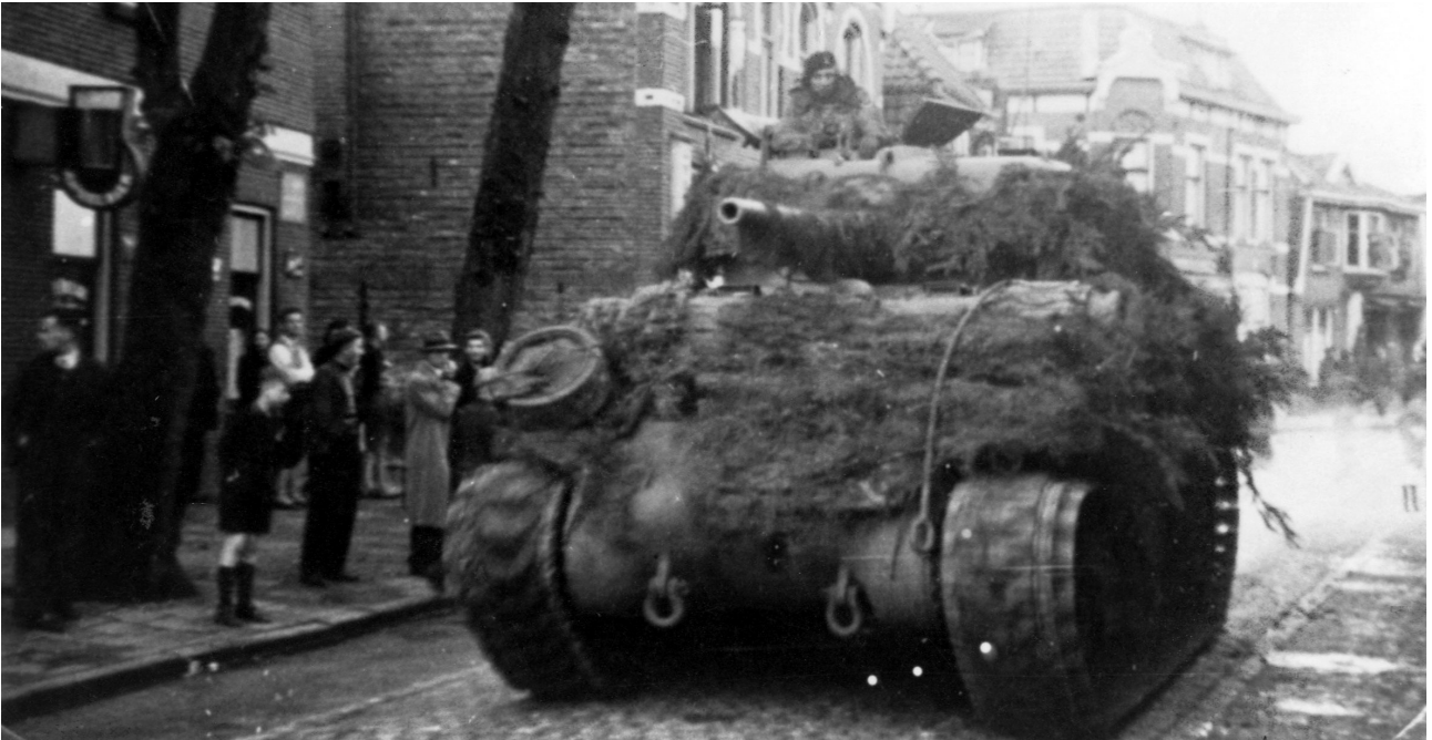
Een Sherman tank van de Sherwood Rangers in de Grotestraat.

de verder oprukken. Zij trekken op 4 april Delden binnen en van daaruit door naar Borne, waar zij de posities van de Sherwood Rangers overnemen. Deze trekken zich vervolgens terug op Hengelo en blijven daar twee dagen.