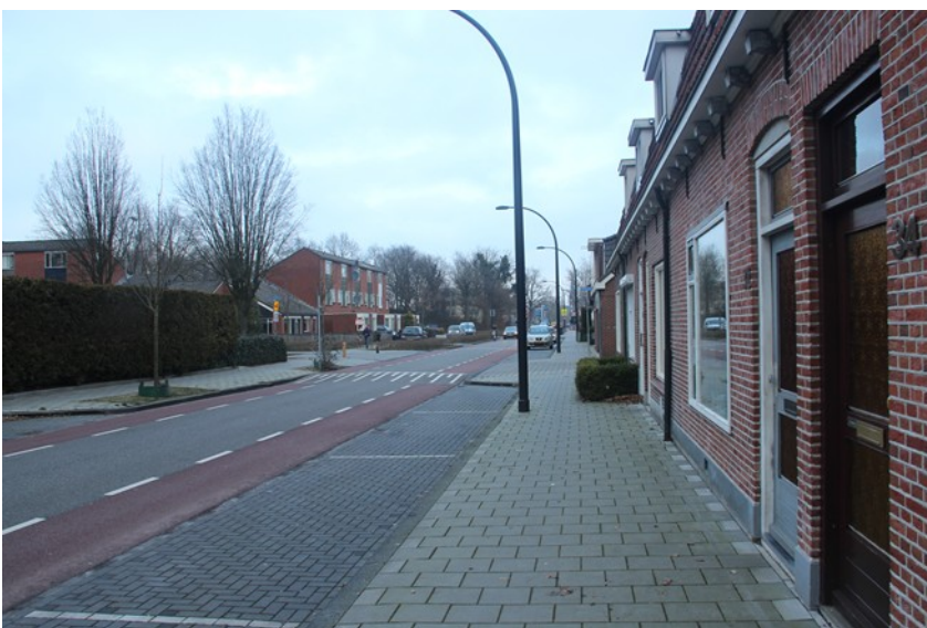
(2) Links voor de spoorwegovergang stond de fabriek van Ledeboer.

Als de lonen bij Ledeboer moesten worden uitbetaald, werd het manusje van alles Roesink er op uit-