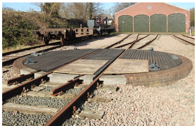
(5) Draaischijf museum spoorlijn Boekelo.