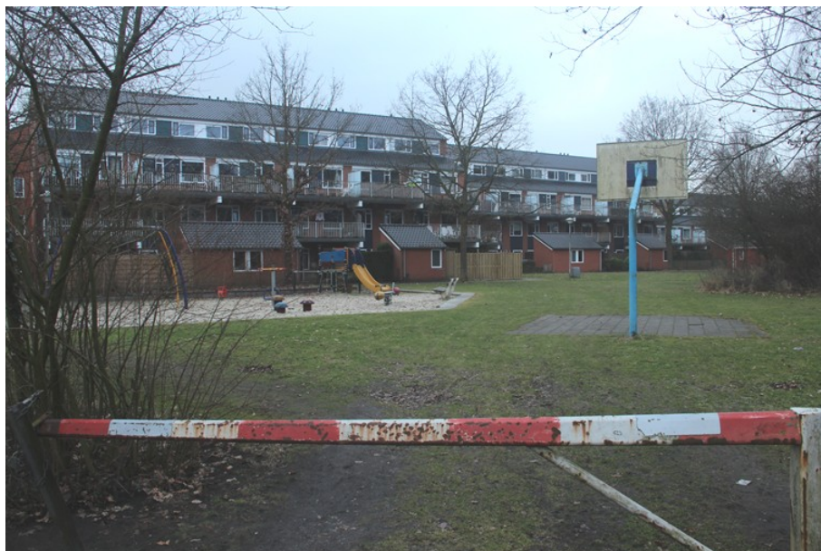
(8) Het terrein boven de oude fundering, nu een speelplaatsje.

Het terrein van de Refined fabriek aan de Deldensestraat heeft lange tijd braak gelegen. In 1980 werden er woningen gebouwd. In de grond van het terrein zat op meerdere plaatsen nog veel van de oude fabrieksfundering. Die is blijven zitten, omdat verwijderen daarvan te kostbaar bleek. Op die plekken is een ruim grasveld naast de woningen aangelegd.