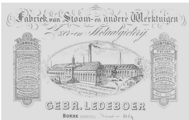
(4) Het brievenhoofd uit 1889 van de firma.

gestuurd om geld te wisselen bij de pastoor van de Stephanuskerk, die dankzij de collectes over voldoende kleingeld beschikte. Ook moest hij voor de arbeiders vaak melk halen bij café Mentink aan de overkant van de Deldensestraat. Maar soms zat er ook wel jenever in de koffiefles.