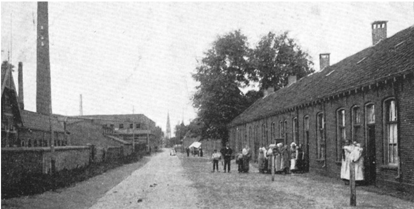
(1) Links de fabriek van Ledeboer, rechts de arbeiderswoningen.

Machinefabriek Ledeboer stond aan de Deldensestraat naast de spoorlijn. Ledeboer produceerde stoomketels voor heel Nederland. Na sluiting van de fabriek vestigde zich de firma American Refined Motor Company in de fabrieksgebouwen. De huidige woonwijk op die locatie is er naar vernoemd.