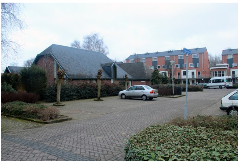
(7) De wijk Refined met de nieuwe Baptistenkerk aan de Twijnerstraat.