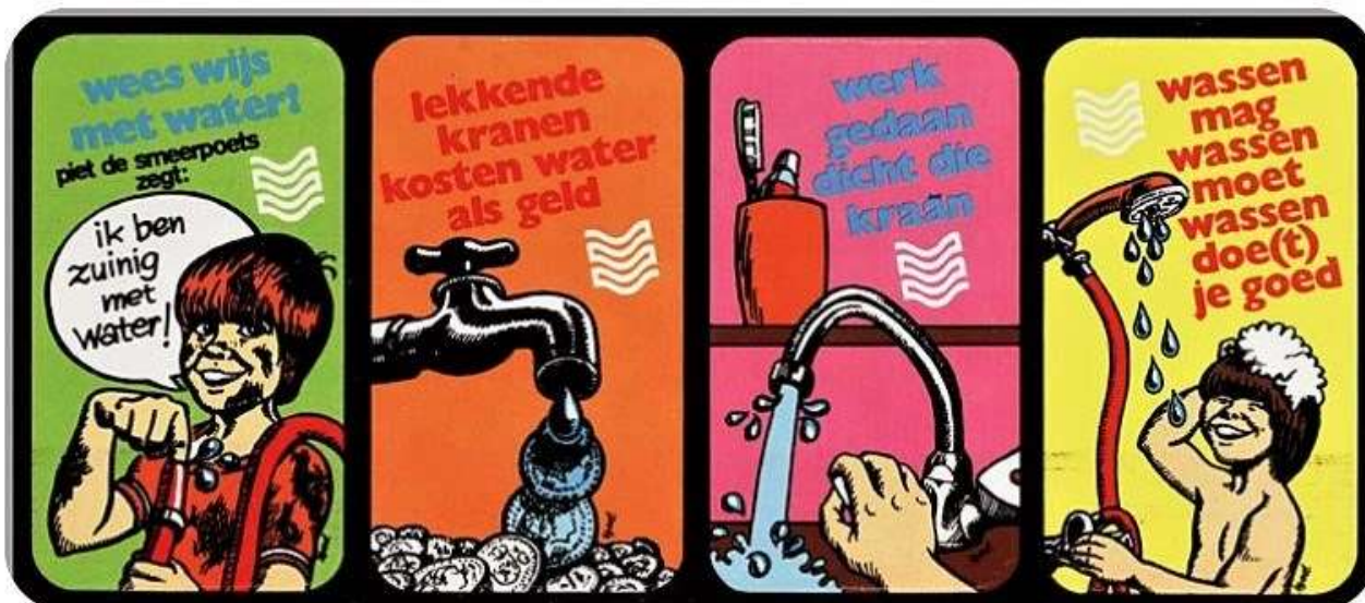
Tips in het kader van de actie 'wees wijs met water', bijna 50 jaar geleden.

We zien dat er in 1972 brede Bornse kring zorgen zijn over het milieu. De ernst ervan dringt door. Er worden voorzichtig eerste stappen gezet. Er is op vele vlakken 50 jaar lang gewerkt aan het terugdringen van de verontreiniging van bodem, water en lucht. Helaas is dit niet in voldoende mate gelukt. Anno 2022 lijkt het er op dat nu echt 'de koe bij de horens' wordt gepakt. Maar dat leek in 1972 ook al het geval. Het is nog niet te laat, maar de tijd dringt.