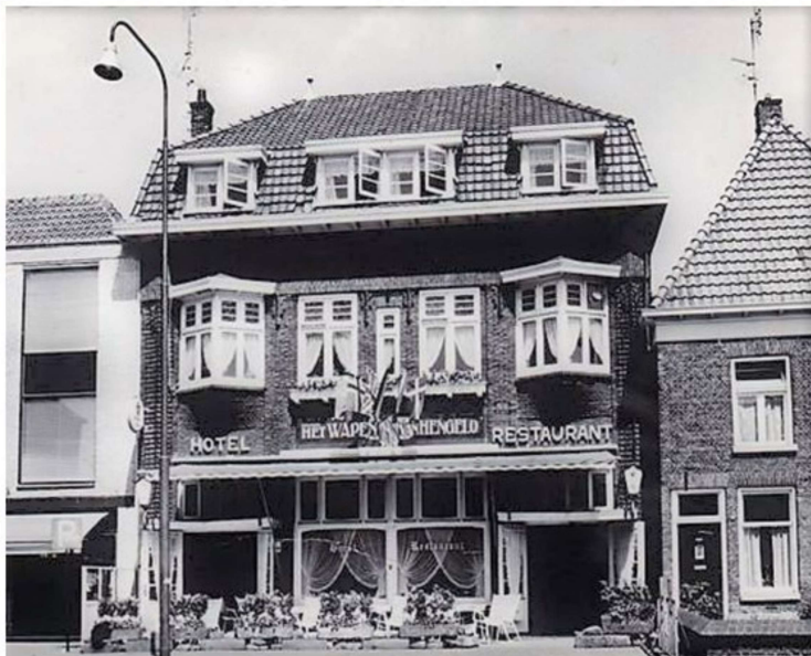
Het Wapen van Hengelo aan de Deldenerstraat

De basis is goed en om toch vooral professioneel over te komen, wordt besloten lidmaatschapskaarten uit te geven. Deze kaarten moeten zijn voorzien van een pasfoto van het clublid en de handtekeningen van de bestuursleden. De vraag hoeveel van die kaarten er zijn uitgegeven, wordt met een grote aarzeling beantwoord: ...????... dertig? Hoe dan ook, Tubantia kondigt aan dat er een filiaal van de Black Corner Club wordt geopend en het feest kan beginnen. Maar hoewel alles dik in orde is, loopt het niet storm. Ondanks bijzondere activiteiten zoals een actie voor 'hongerig India' met medewerking van de MNM's, voorheen The Rangers, de huisband van de BCC.