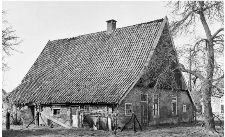
Het Mezenhoes. Tussen de boom en het huis is de houten elektriciteitspaal nog zichtbaar

De werkzaamheden vorderen gestaag en er ontstaat een ruimte die ondanks het gebruik van basale middelen best wel gezellig en knus genoemd mag worden. Maar ja, het geld groeit de beide jeugdige on-