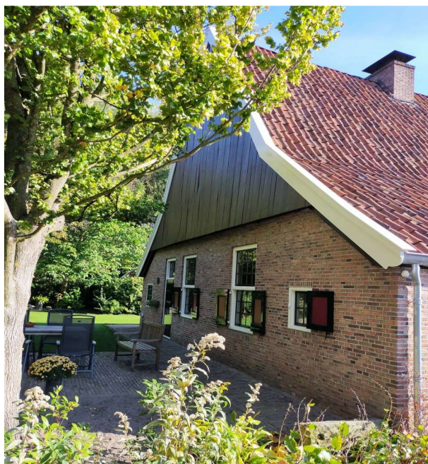
Tegenwoordig wijst niets er meer op dat hier ooit een beatclub gevestigd was