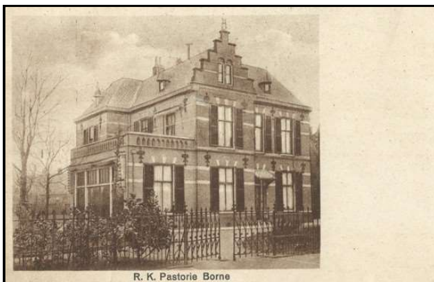
R. K. Pastorie Borne