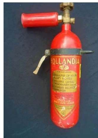
Brandblussers van Hollandia—1930 en 1956