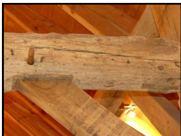
Oude en nieuwe balken

zoveel mogelijk met gebruik van de oorspronkelijke materi-alen. Op veel plekken is nu de nok weer