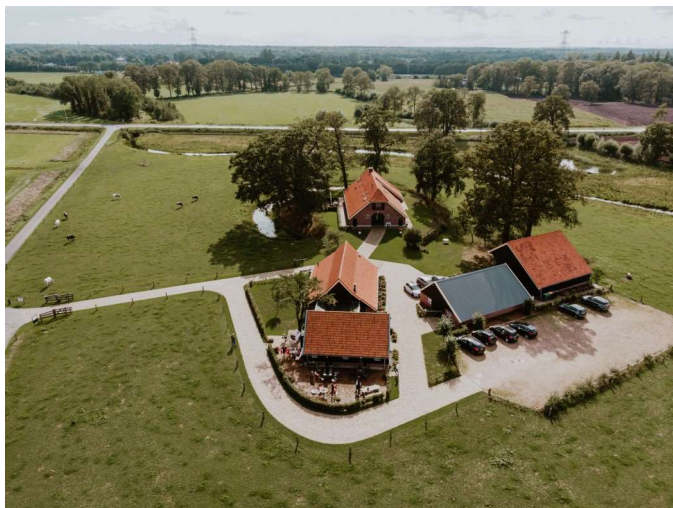
Luchtfoto van de Hondeborg