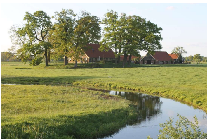
Erve Hondeborg gezien vanaf de Bornerbroeksestraat

De auteurs van dit artikel hebben het plan opgevat om een serie te maken over bijzondere panden en hun bewoners in de gemeente Borne. Dit is hun eerste bijdrage. Die begint bij markante gebouwen, zichtbaar vanaf de Bornerbroeksestraat: De Hondeborg.