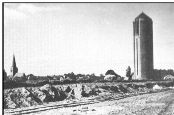
Het depot voor munitie en brandstof bevond zich links van de watertoren aan de rondweg

erg leuk iemand. Hij lacht aldoor toch is z'n lach niet aanstellerig hij is knap betrekkelijk oud, hij heeft twee schatten van kinderen waarvan ie ons de foto's liet zien. Twee of drie avonden ben ik naar hem toe geweest, hij wilde me 's avonds nooit laten gaan. Hij zette echte koffie, pinda's kreeg ik van hem en heerlijke koek waar alle soorten vruchten en nooten inzaten. Als ik op stond om weg te gaan lokte hij me