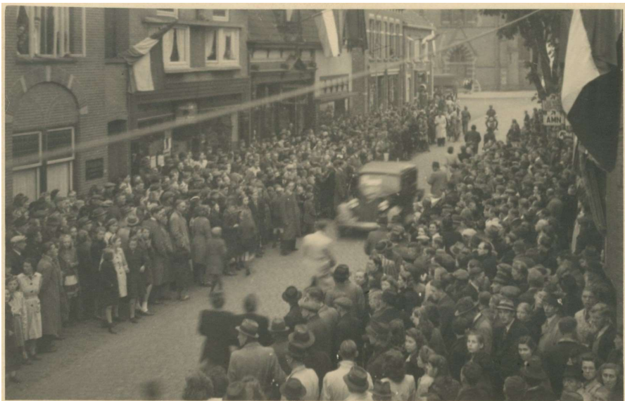
Voor Radio Muller luistert een menigte via een luidspreker naar radioberichten over de bevrijding

8 Mei '45 was de VE-dag 24) . Over geheel Europa werd de dag gevierd der "Vrede". Hier in Borne was