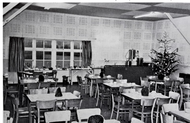
Onder: de kantine aan de binnenzijde (in kerstsfeer).