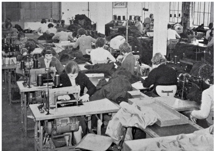
Een overzicht van het atelier in 1957

Er werd een regeling getroffen met vervoersbedrijf de T.E.T. Een buslijn die in de jaren vijftig alleen van Enschede naar Hengelo reed, werd uitgebreid naar Borne. "Nu kan ons personeel uit Hengelo ook mooi op tijd komen", werd genoteerd en dat was belangrijk want er werd nog gewerkt met een prikklok.