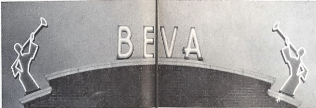
De gevel met de trompetters

Het meest bekende product dat uiteindelijk op grote schaal in Borne werd gefabriceerd, was ook een onderdeel van de lijn BEVA-vakkleding: de overall. De merknaam was een afkorting van de woorden Bendiens Vakkleding. De letters, vergezeld van twee trompetters, sierden een aantal jaren de gevel van het gebouw aan de Bekenhorst.