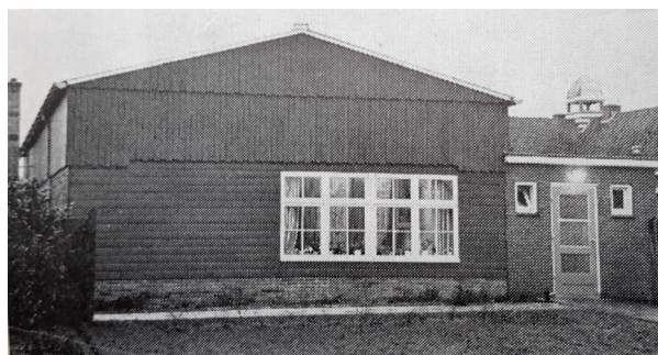
Boven: de kantine aan de buitenkant met daarachter, rechts, het 'torentje' van de Jacobusschool.

Toen in 1961 de toen nog in Borne gevestigde R.K. Landbouwwinterschool naar Delden verhuisde, werd het gebouwtje, waarin de school was gehuisvest, overgenomen door orkestvereniging St. Stephanus. Aanpassing en inrichting van de aankoop zou een vrij kostbare aangelegenheid worden. Aangezien het pand zich pal naast de tuin van Bendien bevond en de firma al enkele jaren kampte met een nijpend ruimtegebrek, werd er een deal gesloten. Het gebouwtje werd voor rekening van Bendien verbouwd en wel zodanig dat er twee ruimtes ontstonden waarvan beide partijen gebruik konden maken: een repetitielokaal en een vergaderruimte voor St. Stephanus die door Bendien als tegenprestatie ook gebruikt konden worden als kantine en leslokaal.