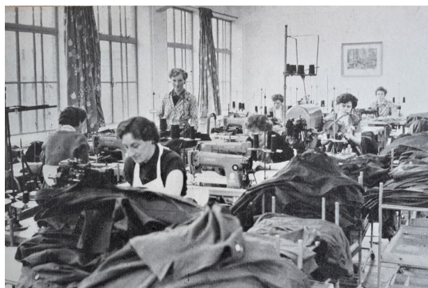
De stof- en werkjassengroep in 1957

Toen de joppers minder in trek raakten, werd er een hemdengroep gevormd waarover wordt geschreven dat elf meisjes garant stonden voor de productie van honderden hemden per dag. Er werd flink aangepoot dus. Ook door een team van 7 meisjes, beschreven als klein in getal maar groot in daden, die de stof- en werkmansjassengroep vormde. Hiervan werd gezegd dat de productiecijfers hoog waren en de kwaliteit goed.