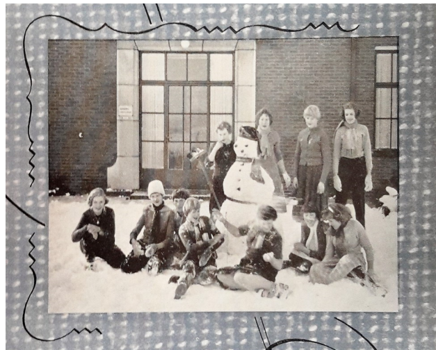
“De meisjes van de klas in Borne hebben een forse sneeuwpop gebouwd”

Met de groei van vestiging Borne nam ook het aantal activiteiten toe, zoals de opleiding van het eigen personeel. Nieuwe, meestal jonge werknemers volgden een leertraject in een zogenaamde V.O.C.-klas van de Vakopleiding Confectie-industrie.