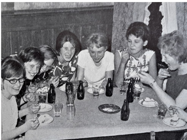
Limonade met gebak na de uitreiking van het diploma in de Keizerskroon (1964)

Met de ouders van de jongedames in opleiding werd een goed contact onderhouden middels ouderavonden en moedermiddagen waarvoor door de leerlingen vaak een kleine tentoonstelling was ingericht. Met name de moeders werd een kijkje geboden in het verloop van de opleiding