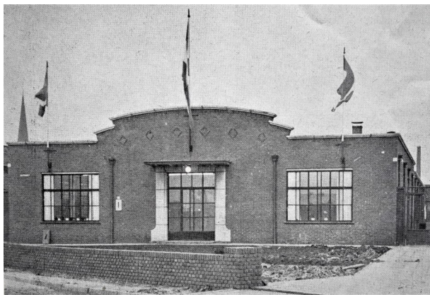
Confectieatelier Bendien aan de Bekenhorst.

Op 14 juli 1954 vond in de Keizerskroon te Borne de openbare verkoop plaats van het in 1949 gebouwde bedrijfspand van confectieatelier Lievenboom 1) aan de Bekenhorst. Bendien uit Almelo werd eigenaar van de opstallen voor F. 75.500,-. Na een paar kleine verbouwingen was het gebouw klaar voor gebruik en in de loop van het nieuwe jaar werd de omgeving van het bedrijfspand nog eens goed onderhanden genomen. Gemeentewerken Borne had gezorgd voor een nieuwe trottoir, er was straatverlichting aangebracht, het eigen terrein was eveneens voorzien van deugdelijke verlichting en de tuin werd flink opgeknapt.