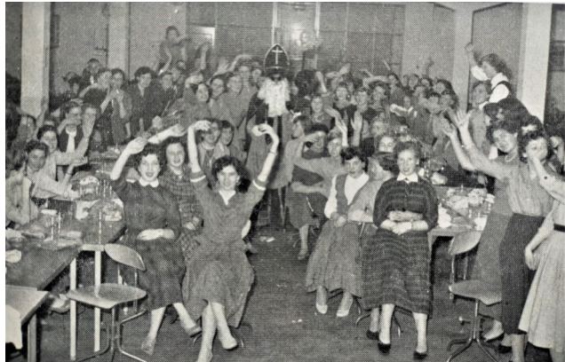
St. Nicolaasmiddag, december 1957

gingen onder kopjes als: “Wij heten welkom in Almelo”, “Nieuwe gezichten in Emmen” of “Ons personeel in Borne groeit.” Ook werden de werkzaamheden binnen de afdelingen onder de loep genomen en met foto’s ondersteund. Veel aandacht was er voor jaarlijks terugkerende hoogtepunten als de vakantie, het Sinterklaasfeest en Kerstmis.