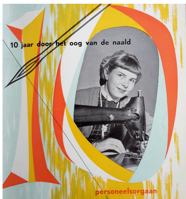
De cover van het personeelsblad Speciale uitgave t.g.v. het tienjarig bestaan

In het personeelsblad werd speciaal voor Borne een rubriekje ingeruimd onder het kopje ‘In en om de Bijenkorf’ en de meisjes werden uitgedaagd om de