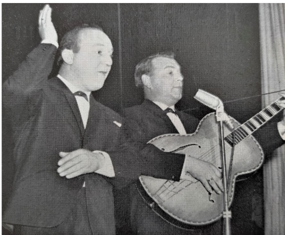
De Mounties in Hotel van der Laan tijdens de verwelkoming van het honderdste personeelslid.