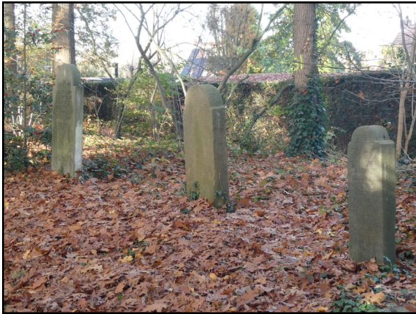
De huidige joodse begraafplaats aan de Twijnerstraat. Op de foto staan de 3 oude stenen van de Burenweg die aan de Twijnerstraat zijn herplaatst bij de herbegraven resten. (Afb. 2)

Met de foto's uit het Jaarboek Twente in de hand, probeerde ik de locatie aan de Burenstraat terug te vinden. Dat viel mee, want rechts naast de ingangspoort van De Lemerij ligt een verlaagd (afgegraven) grasveld en er staan nog twee zandstenen zuilen met resten van de ijzeren stangen er in (Afb. 3). Achter één van de gemetselde zuilen van de ingangspoort ligt zelfs nog de oorspronkelijke