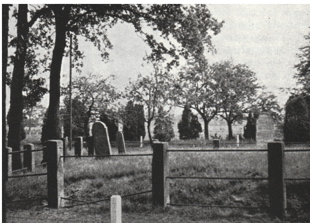
De oude joodse begraafplaats te Buuren (Borne) 1959 (afb. 1 in de tekst)

In Borne wordt Isaac Heiman in 1695 genoemd als inwoner 2) . We kennen uit die tijd de inwoners vaak alleen maar uit belastinggegevens of rechterlijke archieven. Het is dus niet onmogelijk dat er zich in de 17 e eeuw al wat meer joden hadden gevestigd, maar veel zullen het er niet zijn geweest. Gedurende de hele 18 e eeuw is melding gemaakt van beperkte aantallen joodse inwoners. In 1748 waren er bij de volkstelling twee joodse families. Dan wordt "Judit de weduwe van Isaak de Joode" (Isaac Elias Heyman) genoemd. Waarschijnlijk is haar man dus al voor 1748 op de begraafplaats begraven. In 1725 leefde hij nog, want mevrouw van Harten vermeldt: "Isaak de Joode was slachter". Bij de begrafenis van de Vrouwe Anna Elisabeth Scheele in 1725 had Isaak rund- en lamsvlees geleverd voor 11 gulden, 7 st. en