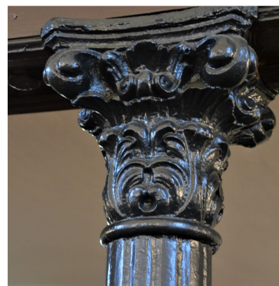
foto rechts: een van de gietijzeren kolommen onder het orgelbalkon uit 1884, ook in Borne gegoten.

Hoe het precies is afgelopen, is in de archieven niet terug te vinden. Wel is bekend, dat er binnen de Staten van Overijssel ongenoegen was over het feit dat de drost zijn plakkaat had uitgevaardigd zonder de formele toestemming van de Staten. En ook is er een aantekening in het register op de resoluties van de Staten uit 1612, waarin gemeld wordt dat er in de eerstvolgende vergadering op zou worden teruggekomen en dat intussen de doopsgezinden in Twente ongemoeid zouden worden gelaten, maar dat openbare godsdienstoefeningen niet werden toegestaan. In het rekest van 10 oktober 1612 vinden we onder de ondertekenaars de namen van vier Bornse doopsgezinden: Geryt Toenesen, Tonys Geryts, Hyndryck Gerytzen, en Peter Willemsen. Daarmee zijn zij de oudste ons bekende doopsgezinden in Borne en naaste omgeving.