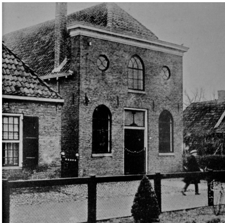
De Vermaning aan de Ennekerdijk. Nog met de schoorsteen van de enige kachel en een deel van de kosterwoning.

zou gaan als de werkelijke organisator van de herleving van het katholicisme in Nederland. Bij de (Staatse) drost van Twente, Unico Ripperda, kwam Rovenius op voor de belangen van de Twentse katholieken, maar ook drong hij erop aan op te treden tegen de doopsgezinden in Twente: 'Men sal niet toelaten eenige vergaderingen der Mennonisten ofte wederdopers', was een van de actiepunten die Rovenius aan de drost voorlegde.