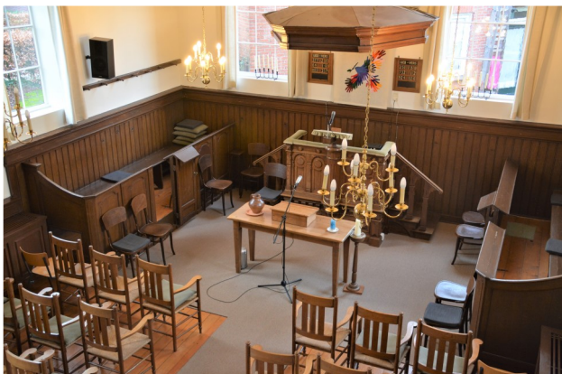
Foto boven: blik vanaf het orgelbalkon; de voormalige kerkenraadsbanken worden nu door de cantorij gebruikt.

Enkele bezittingen van de Doopsgezinde Gemeente Borne bevinden zich nu in museum het Bussemakershuis, een stukje eerder aan de Ennekerdijk, dat mooi laat zien hoe een doopsgezinde linnenreder vroeger woonde en werkte. En op de hoek van de Ennekerdijk en de Brinkstraat getuigt de Bornse Vermaning als een levend monument van het gemeentelieven der doopsgezinden. Dankzij de betrokkenheid van alle generaties die het gebouw gebruikten