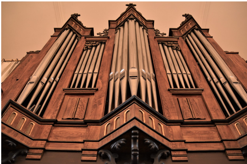
Front van het Haupt-orgel uit 1886