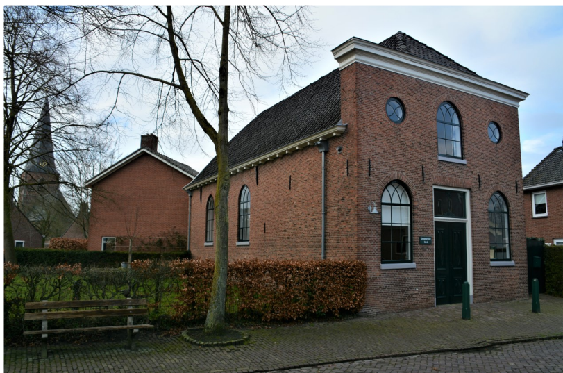
De Vermaning uit 1824 met erachter de 'pastorie' uit 1967.

Zo werd op 31 december 2008 feitelijk invulling gegeven aan de clauseule in de Acte van Deling van 1728. Onze voorzaten hadden niet kunnen denken dat die na krap driehonderd jaar nog in werking zou treden. We zullen in het midden laten of Hengelo in Borne terugkeerde of andersom. De fusie is in goede harmonie verlopen, maar betekende het einde van het bijna 400-jarig bestaan van de zelfstandige Doopsgezinde Gemeente Borne. Maar de activiteiten gaan onverminderd door, want de kerk aan de Ennekerdijk is nu het onderkomen van de Doopsgezinde Gemeente Twente Zuid-Oost, die nog wel veel leden heeft in de gebieden van de vroegere gemeenten Enschede en Hengelo, maar geen kerken meer. Samen met de doopsgezinde kerk aan de Grotestraat in Almelo is de Bornse Vermaning nu een thuis voor alle Twentse doopsgezinden, die een open en actieve gemeenschap vormen van leden, vrienden en belangstellenden, waar ieder zijn eigen weg in geloofszaken en velen proberen te leven volgens de laatste regel van het wandbord in de Vermaning: 'Daden gaan woorden te boven'.