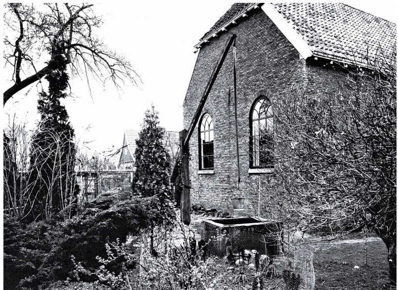
Achterzijde van De Vermaning uit 1824, met vierkante Bentheimer put in de tuin.

Ds. Van Cleeff werd predikant van een doopsgezinde gemeente die zich sinds kort openlijk mocht manifesteren. Sinds de Bataafse staatsregeling van 1798 was de godsdienstvrijheid grondwettelijk verzekerd en alom in het land begonnen doopsgezinden een rol te spelen in het maatschappelijk leven. Naast de schuur waar men sinds een eeuw bijeenkwam, liet de doopsgezinde gemeente in 1824 een nieuw gebouw optrekken dat ook naar buiten toe zichtbaar een kerkgebouw is. De stijl sluit aan bij de traditionele soberheid van de gemeente, maar de voorgevel heeft toch ook een zekere statigheid. Ds. Van Cleeff zal er nog tot eind 1857 de preekstoel bestijgen. Met een dienstverband van 48 jaar kon hij geen onbekende blijven in de kleine Bornse gemeenschap. Een paar jaar geleden ontdekten we dat hij de organisator is geweest van een leesgenootschap en zo ook een rol heeft gespeeld in het culturele leven van het dorp.