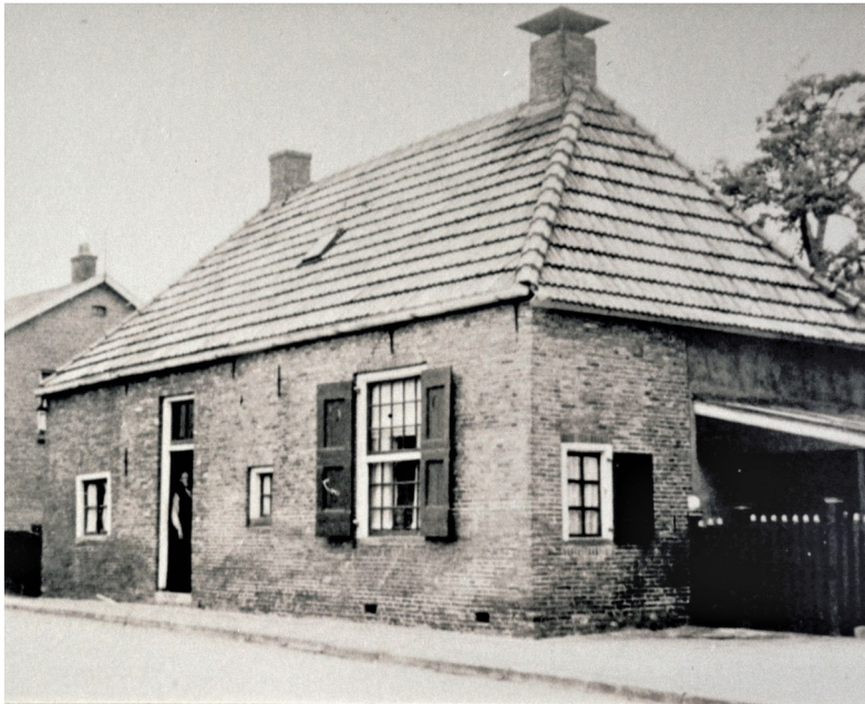
De oude kosterwoning, en voor 1824 de plaats van samenkomst

aan het interieur en vooral aan het orgel. Kerk en orgel waren al wel rijksmonumenten geworden maar dit leverde nog niet de financiële ondersteuning op die nu dringend nodig was.