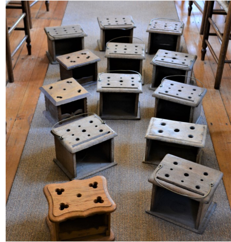
foto rechts: De stoven deden dienst tot de aanleg van cv in 1984.

foto links: bijen brengen honing naar de korf boven de nis in de consistoriekamer waarin tot 1984 de enige kachel stond.