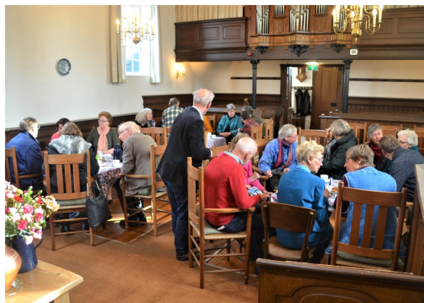
Koffie drinken na de dienst.

en nog steeds gebruiken, is het gebouw goed onderhouden. Het zal hopelijk nog lang zijn functie blijven vervullen op een wijze die past bij deze tijd.