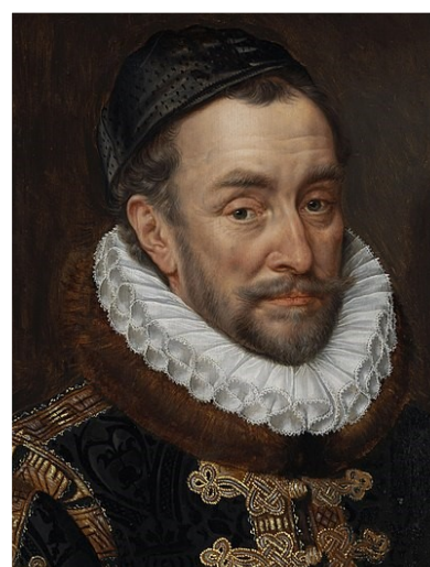
Willem van Oranje Schilder: Adriaen Thomasz Key (1579)