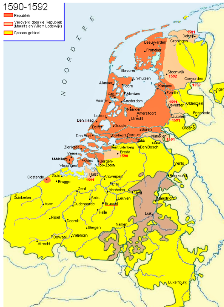
Nederlanden 1590-1592.