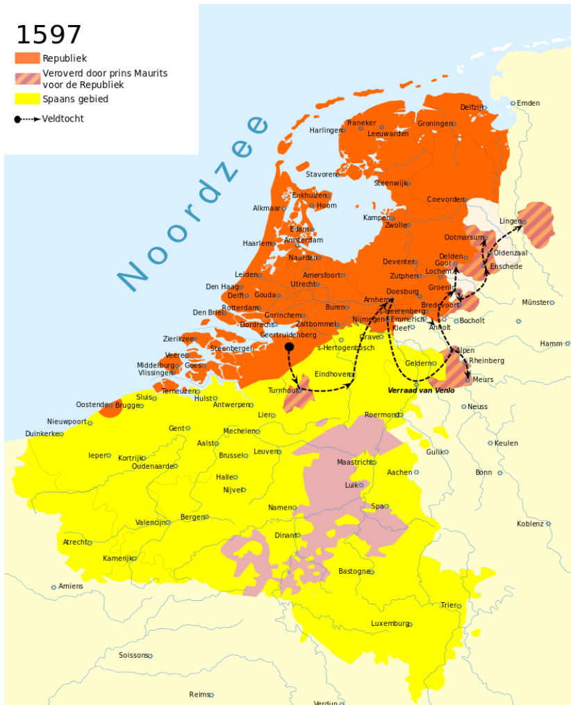
Nederlanden 1597

plaats tussen Geldern en Wesel ) ingenomen en daarna het dichtbij gelegen Rijnberk ( thans Rheinberg geheten ) veroverd. Het was nu 20 augustus. Maurits besloot hiertoe omdat van daaruit de noordelijker gelegen steden in de Graafschap Zutphen, Twente en het Graafschap Lingen gemakkelijker in te nemen waren.