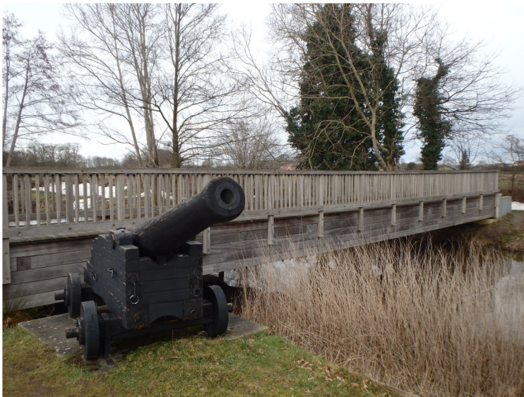
De Mauritsbrug bij Beuningen

Begin 1600 begint de opmaat naar een bestand, dat in 1609 gesloten wordt. Het bestand zal uiteindelijk 12 jaar duren, dus tot 1621. Het is een periode waarin de bevolking eindelijk weer wat rust krijgt en waarin weer iets van opbouw kan plaats vinden. Eindelijk kunnen de wonden gelikt worden ....., het was meer dan hard nodig!