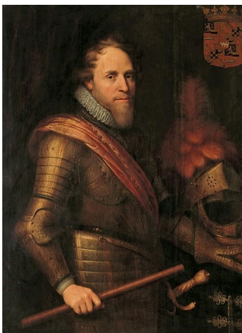
Maurits van Nassau

We zitten nu met ons verhaal in de periode rond 1590 en het wordt tijd om de focus te gaan richten op Maurits van Oranje, die als kapitein-generaal van 1588 tot 1598 het leger aanvoerde tegen Spanje.