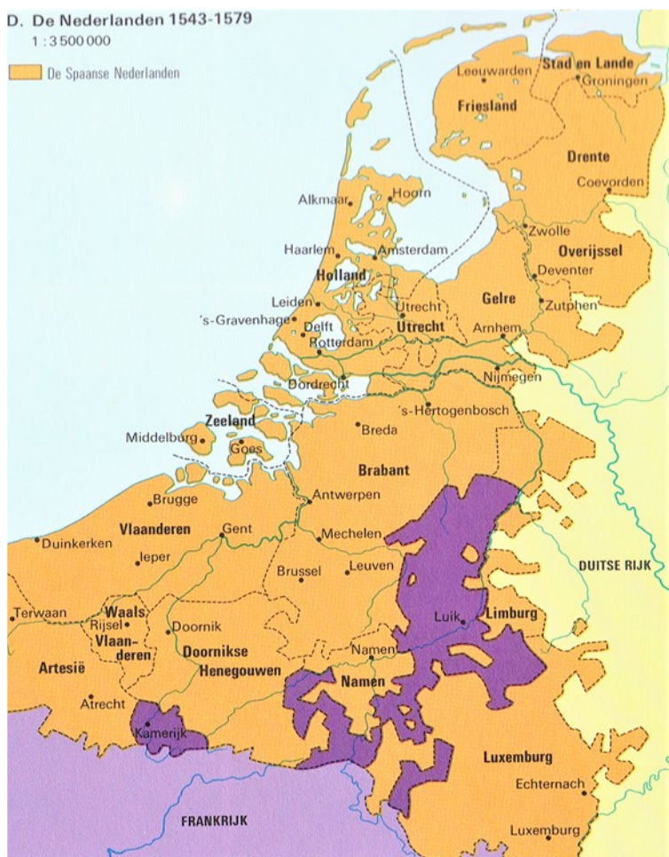
De Nederlanden van 1543 tot 1579, Bisdom Luik is neutraal gebied.

In 1559 wordt Willem van Oranje door Filips II benoemd tot Stadhouder (= plaatsvervanger van de regerend Heer