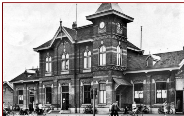
Toenmalig station Almelo

gedaan hebben om niet gezien te worden. Maar deze handelswijze was opgevalen 2 . Door niet in de 3 de klasse te stappen maar in de 2 de klasse viel het juist op. Hij was allereerst naar Amsterdam gegaan, waar een familiezaak werd geregeld 3 . Daarna ging