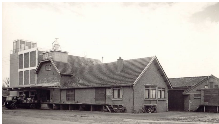
De A.B.T.B. aan de Pastoor Ossestraat.