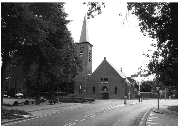
De RK kerk gezien vanaf de Entersestraat.