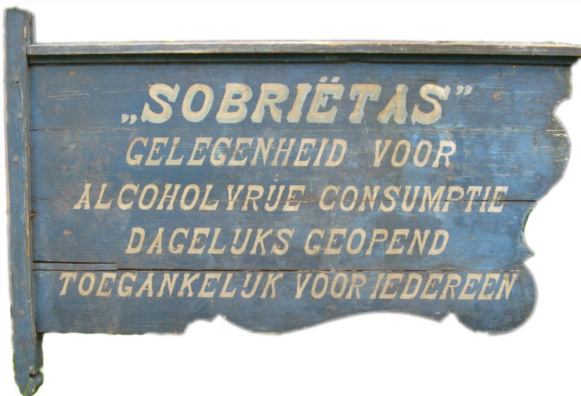
Het originele uithangbord van het geheelonthouderslokaal dat destijds de gevel van Grotestraat 178 sierde. Uiteraard blauw geschilderd; de kleur van de drankbestrijding.

Hoewel niet vermeld in het krantenartikel, slechts wordt gewag gemaakt dat de pastoor en kape-laans samenwerkten met andere drankbestrijdingsorganisaties, is bekend dat groenteboer Grootenhaar, lid van de Goede Tempeliers, ook tot de initiatiefnemers behoorde.