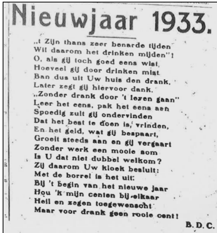
Bericht in de Bornsche Courant van 31-12-1932 van het Bornsch Drankweercmité.