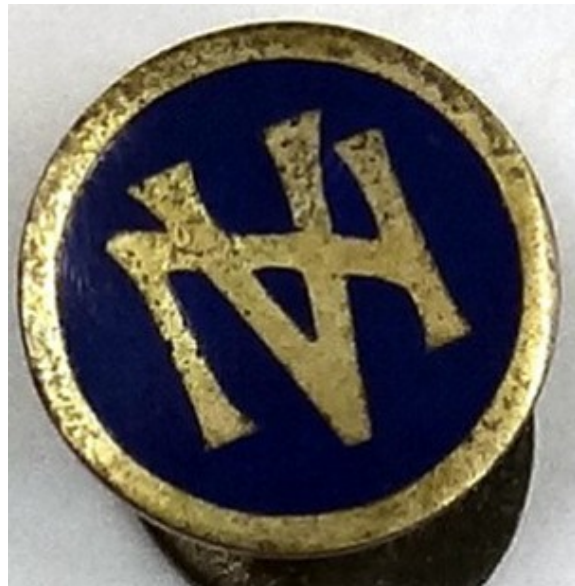
Reversknop van de Nederlandsche Vereeniging tot Afschaffing van Sterken Drank 4 .

Eind 1895 wordt het Bornse Kruisverbond St. Bernardus opgericht 3 . In de periode tot 1900 ontstaan