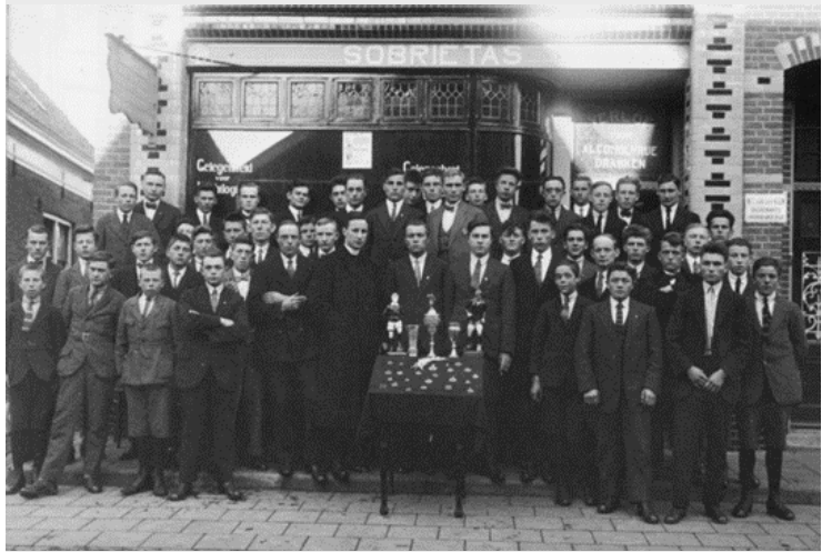
Leden van voetbalvereniging NEO poseren in 1924 bij gelegenheid van het eerste lustrum voor het geheelonthouderslokaal. Het uithangbord, geheel links boven op de foto, is bewaard gebleven.

Kastelein Jannes Groot Rouwen laat in 1915 een dubbel woonhuis bouwen: Grotestraat 176 en 178. Vermoedelijk wordt in 1925 het gehele pand (176 en 178) verkocht aan slager Jenne Meinema. Nummer 178 wordt in hetzelfde jaar verbouwd tot een slagerij. Meinema verkoopt het op zijn beurt in 1952 aan slager Kamphof. Sinds enige tijd is in het pand een kledingwinkel gevestigd 33 .