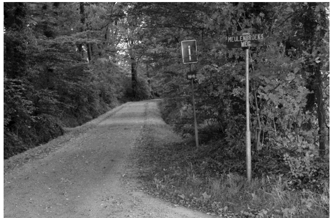
Weg naar de boerderij; Meulenbroeksweg