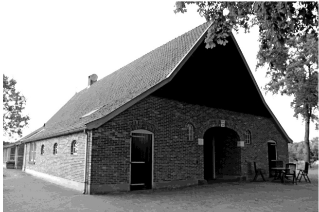
Het Meulenbroek anno 2014