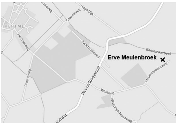
Toegang tot de boerderij: Meulenbroeksweg

Ceciel Meulenbroek kwam met de akten naar het Historisch Informatie Punt in de bibliotheek met de vraag, of de heemkundevereniging er iets mee kon. Zij zelf kon de handgeschreven akten namelijk niet lezen.