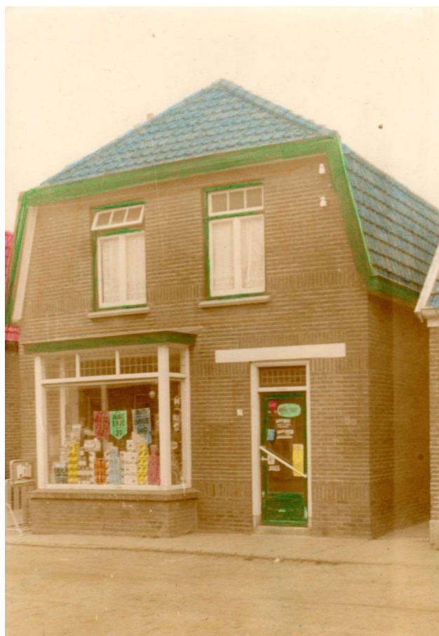
De winkel aan de Tichelweg vlak na de oorlog. (ingekleurde sepia foto)