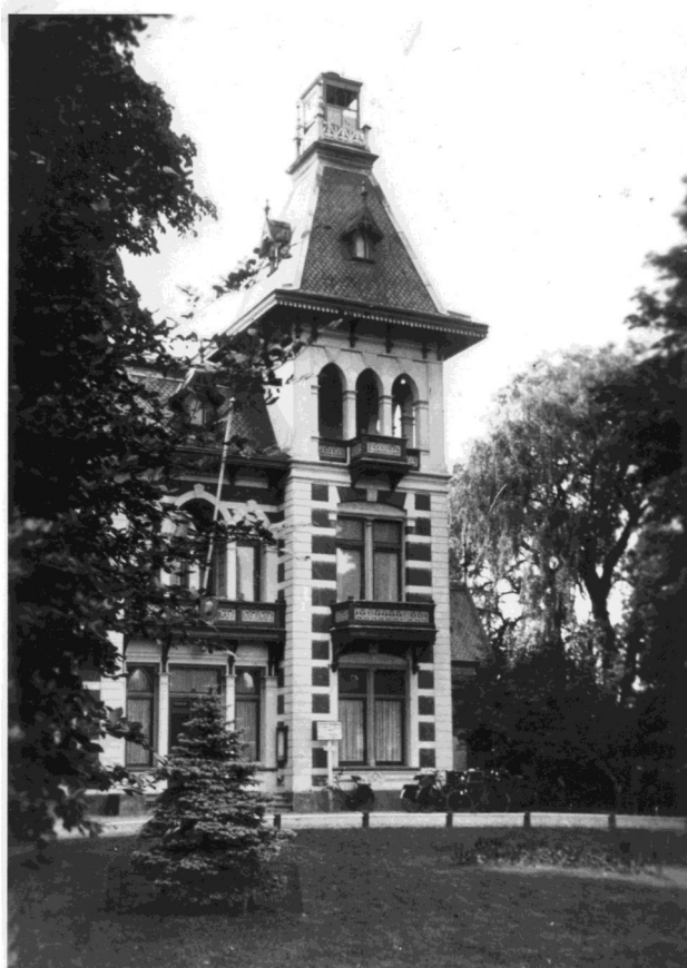
Villa Elisabeth met bovenop het uitkijktorentje. Foto: collectie gemeentearchief Borne, nr. 013901

In 1945 werden de uitrukploegen met twee uitgebreid tot vijf. Als laatste was er de geneeskundige dienst met als hoofd dr. W. Stomps, met drie uitrukploegen, verder geleid door dr. Panhuijsen en dr. Van Blanken.