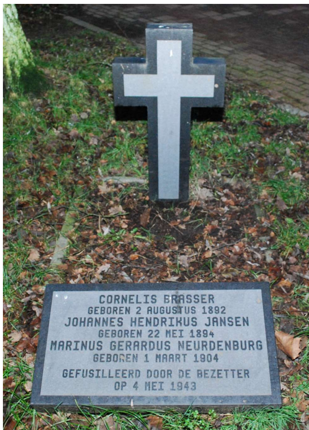
Monument voor de drie gefusilleerden nabij de beek aan de parallelweg van de Rondweg.

In het gemeentearchief zijn nog vele rapporten aanwezig over incidenten die tijdens de bezettingsjaren voorvielen. Om u een idee te geven heb ik er willekeurig drie uitgekozen. In het rapport van 1 maart 1943 rapporteert het hoofd van de LBD dat een vliegtuig van een eskader van vijf, 4 of 5 brisantbommen afwierp. Drie ontploften aan de Wensinkstraat, één in de oude Deldensestraat en een niet ontplofte bom lag aan de Kanaalweg (nu Dunantstraat). Drie personen werden hierbij gedood, meerdere licht gewond. Vier huizen aan de Oude Del-