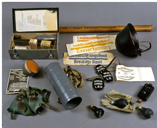
Verskillende artikelen door de LBD gebruikt.