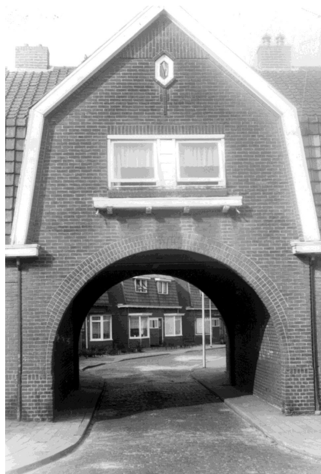
In 1935 komt de familie weer terug in Borne. Ze betrekken dan een woning in de Lantmanstraat, rechts naast het tunneltje.