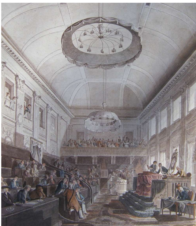
De Nationale vergadering op 2 september 1796.

Langzaam maar zeker (en voor betrokkenen soms tergend langzaam!) veranderen de verhoudingen. De rooms-katholieken konden hun huiskerken, onder een paar beperkende voorwaarden, oprichten. De plaatselijke Joodse gemeenten hielden ongestoord hun bijeenkomsten in hun huissynagogen. Intussen is het rond 1800 de tijd van de grote veranderingen in het land merkbaar. De zeven gewesten zijn het regeren door de rijke families en de landadel zat en ook de Prins Willem V van Oranje-Nassau kon nog weinig goeds doen. Een “fluwelen revolutie” veranderde het politieke beeld van de Nederlanden voorgoed. De gewesten zonden hun vertegenwoordigers naar Den Haag en vormden zo de Representanten van het Volk. In haar vergaderingen werden alle godsdiensten gelijkgesteld. De Gereformeerde kerk verloor haar bijzondere positie. Voor ons onderwerp is vooral de Nationale vergadering van 2 september 1796 van belang. Zij het met de nodige moeite nam de vergadering het voorstel over “Dat geen Jood zal worden uitgesloten van eenige rechten of voordeelen, die aan het Bataafsche burgerregt verknocht zijn” . Dat besluit heeft begrijpelijkwijs