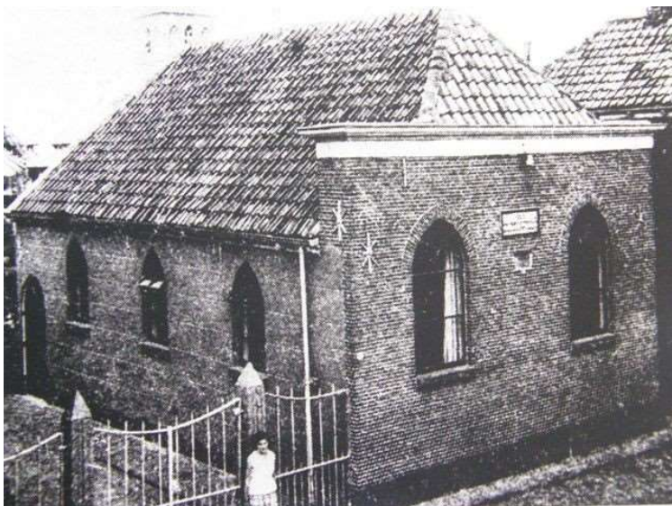
De synagoge aan de Ennekerdijk voor de Tweede Wereldoorlog.