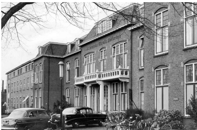
't Zeekenhoes in Hengel.

Wiej schriewt weentermoanden 1969-1970. "En noe plat op de rugge", is alns wat der te kiezen oawer blif. Ik noa 't wekeand 's moandaagenssmorgens der voort hen. De ofdeling neurologie, dee mij tam möt maken, zit vol. "He'j der ok bezwoar tegen da'j achter de klapduuren komt te liggen?" Wat weet ik van achter de klapduuren. As der mear 'n berre steet en ik der de rugge wier tot 'n willen krieg, maakt et mij nich oet. Op de 'psychiatrie', dee der noast lig en oonder de zölfde afdeling vaalt, is ruumte genug.