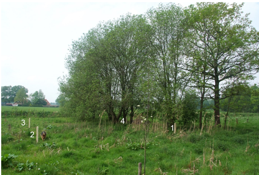
Oud Esschering anno 2014. De palen 1 t/m 4 markeren de hoekpunten. De vierde staat op een stukje oude fundering. Op de achtergrond de woning van de familie Braamhaar aan de Hebbrodweg.

Het mooiste moment kwam toen er een gat gegraven moest worden voor de vierde en laatste paal en op ongeveer 50 cm onder het oppervlak op een stuk fundament van de oude lijftucht werd gestoten. Er is niet verder gegraven om te zien of we ook nog precies op een hoek zaten, maar mede hierdoor mag aangenomen worden dat de palen met een redelijke mate van nauwkeurigheid in het veld staan. Binnen de palen is een speciaal weidebloe-