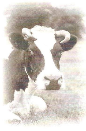
Vele mensen waren moeder lief. Haar lievelingsdier was koe Roosje.

Bidprentjes: de oude, enkele, zijn heel vaak aan de voorzijde voorzien van religieuze afbeeldingen. Soms zien we dat aan de drukker van een bidprentje een open opdracht werd gegeven: de achterzijde met de tekst uiteraard hetzelfde; voor de voorzijde kon dan gekozen worden uit meerdere afbeeldingen, mogelijk afhankelijk van de aanwezige voorraad. Tegenwoordig zijn de bidprentjes bijna altijd dubbel: een meer persoonlijke tekst over de overlede-