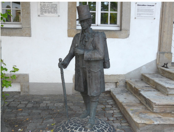
Töddenbeeld te Hopsten

Zo ontwikkelden zich uit de Hollandgänger van het noordelijke Münsterland steeds meer een te onderscheiden groep handelaars, die Tödden genoemd werden. Formeel was er onderscheid tussen de