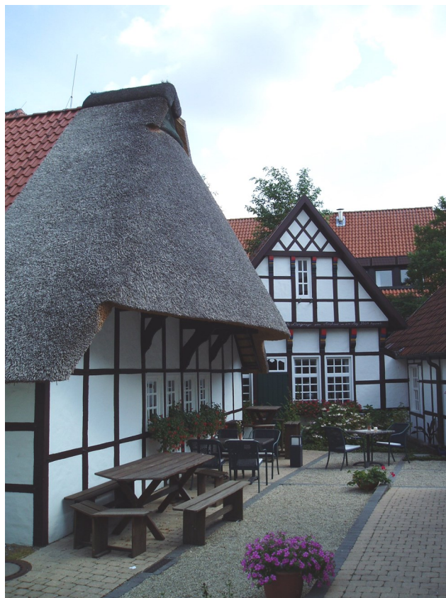
Binnenplaats van het Töddenmuseum in Hotel Telsemeyer in Mettingen