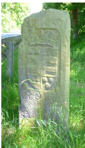
Driekantige grenssteen uit 1659 bij Driland

Grenzen en met name landsgrenzen zijn voor ons vanzelfsprekend. Toch is onze huidige landsgrens pas zo'n twee eeuwen oud en zeker vroeger niet altijd even herkenbaar.