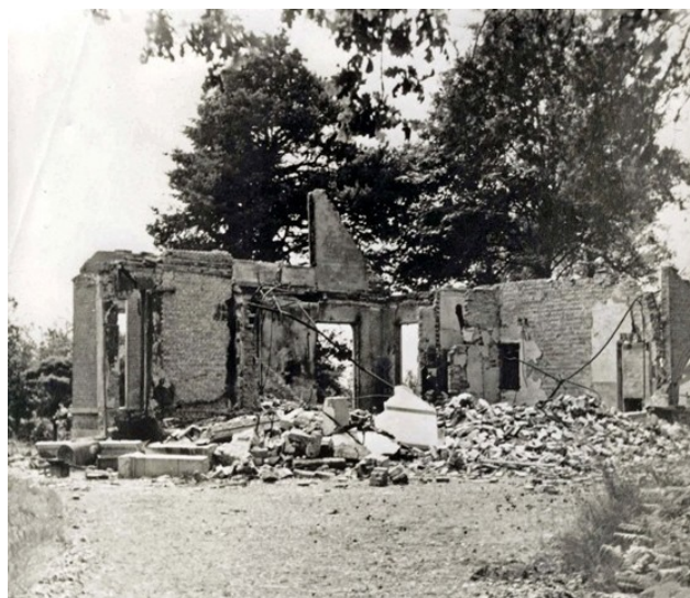
Wat er restte, nadat de Duitsers de villa hadden opgeblazen