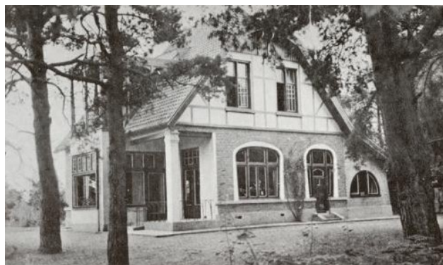
Villa Lidwina vóór de overval