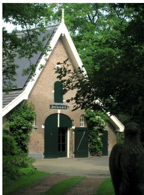
Voormalige boerderij "Hendrikshoeve", nu het "Jachthuis"