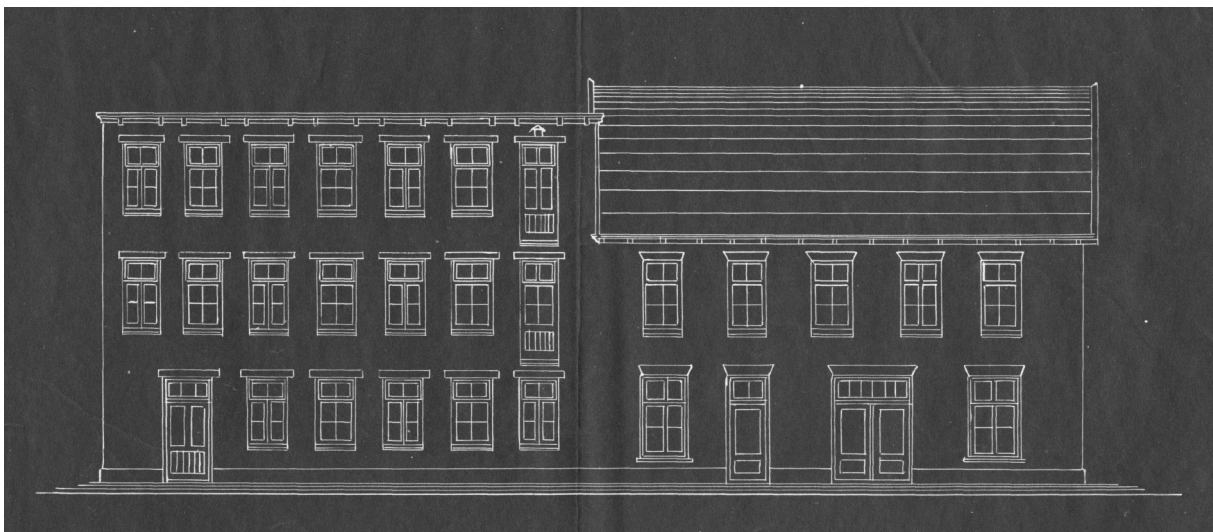
Bouwtekening van de fabriek gezien vanaf de zijkant, in de huidige Bakkersteeg.

Ook Rudolf hield zich intensief bezig met het familiebedrijf. Hij staat vermeld als confectiefabrikant bij zijn overlijden in 1935 op 61-jarige leeftijd.