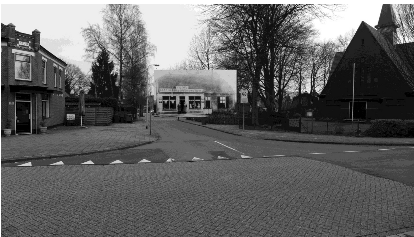
Fotomontage van de eerste locatie aan de Tichelweg.

Het pand, waar de coöperatie haar eerste filiaal had, stond aan de Tichelweg waar deze op de Deldensestraat uitkomt. Dit pand is later afgebroken bij de aanleg van de straat De Dreef, waarbij ook de toegang tot de Tichelweg is verlegd.