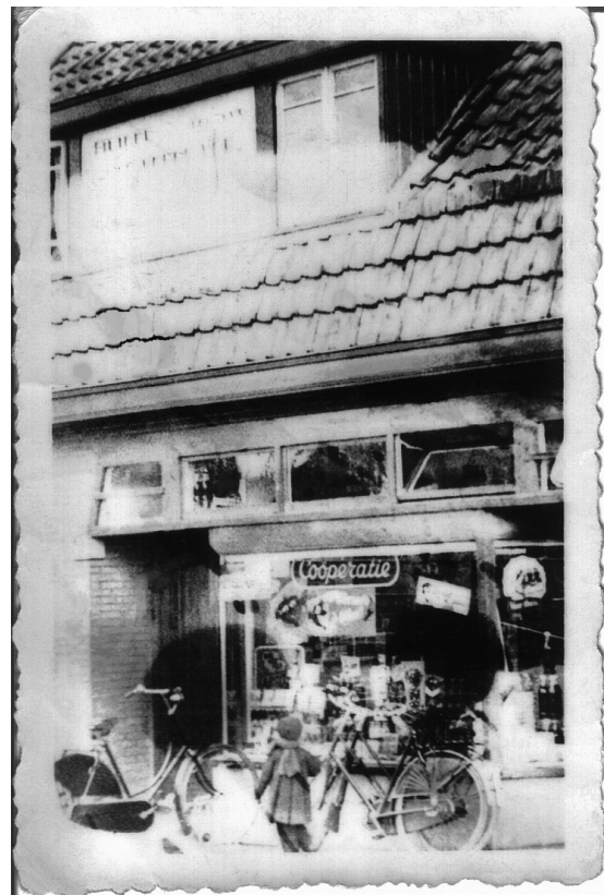
De winkel van de coöperatie aan de Deldensestraat 64.

In 1933 koopt de coöperatie het dubbele woonhuis Deldensestraat 62-64. Op 9 mei wordt de verbouwing van het pand tot winkel en woonhuis aanbesteed door architect F. Jansen 4) . Nummer 64 wordt verbouwd tot winkel en de opening volgt op 30 september 1934 5) .