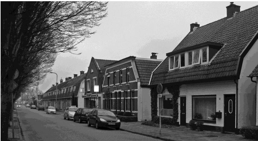
De Deldensestraat gezien in de richting van het spoor. Nummer 64 is het eerste huis rechts.

zijn opvolger nog een klein jaar door. Dan stopt de coöperatie in Borne, nadat ze al in 1960 is gefuseerd met de Coöperatieve bakkerij en verbruiksvereniging "Volksbelang" U.A. te Hengelo 7) .