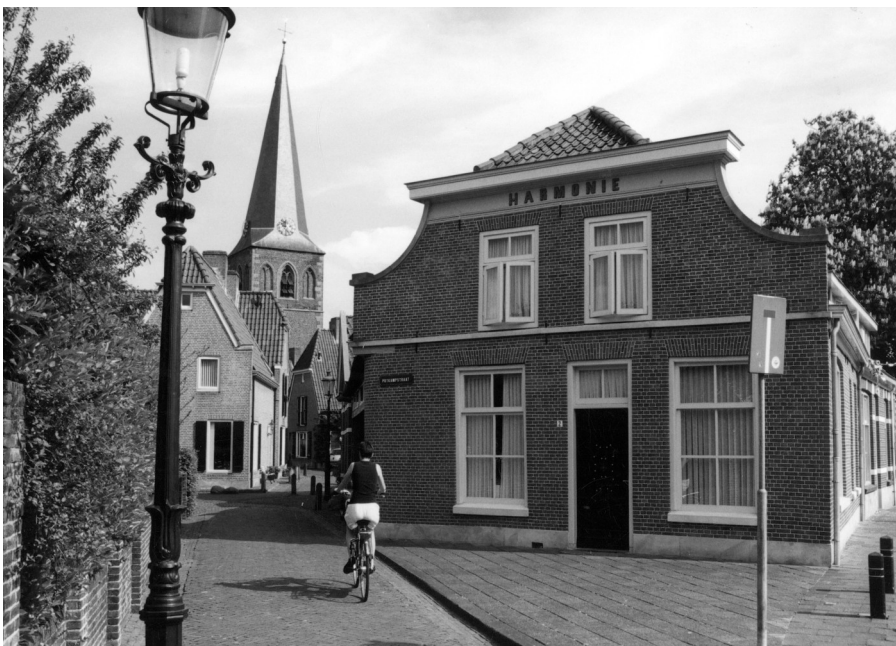
Nu is in het pand IJssalon de Harmonie gevestigd.