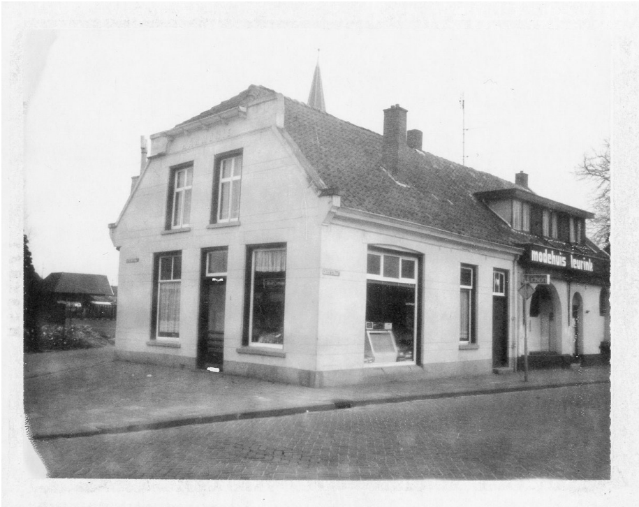
Foto uit de jaren '60 van de negentiende eeuw. In het pand is de groentezaak van Kamman gevestigd. Rechts de winkel van mevrouw Leurink. Foto: collectie gemeentearchief Borne, nr. 000655.

waarvan de indeling niet oorspronkelijk is (twee onderramen en een tweeruits bovenraam waartussen een 'kalf' per kozijn).