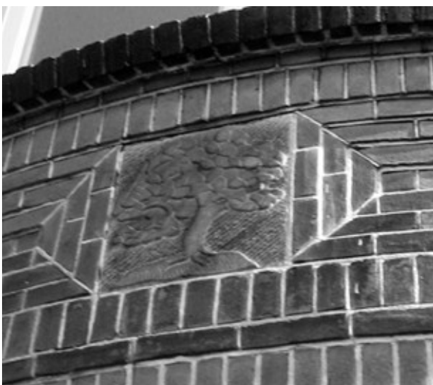
De gevelsteen met "De Boom".

Met de komst van de Franse overheersers (1795-