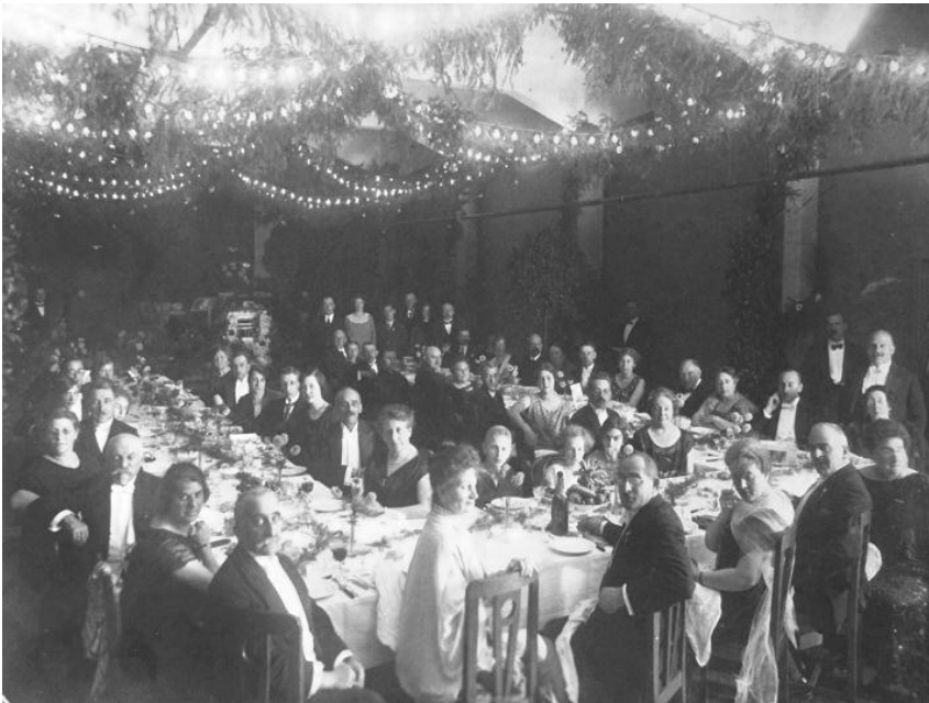
Feestdiner ter gelegenheid van het 60 jarig bestaan van de fabriek in 1924. De tafel is uitbundig gedekt

Ook is het interessant dat al vanaf generatie 3 vele mannelijke Spanjaardnazaten zich aansloten bij de vrijmetselarij. Er bestond kennelijk behoefte om ook buiten de joodse kring sociale contacten te onderhouden en filosofische gesprekken te voeren die niet uitgingen van uitsluitend het jodendom, maar van de gelijkwaardigheid van alle religies. De meeste Spanjaards, die in eerste instantie nog in Twente woonden, werden lid in Deventer of Zutphen. Hierin stonden zij overigens niet alleen, ook leden van andere joodse textielfamilies waren daar lid. Ook buiten Twente deed zich trouwens ditzelfde verschijnsel voor. Als eerste Spanjaard was Izak, de oudste zoon van Jacob, lid van de loge in Deventer. Ook later, na de oprichting van de loge Tubantia in Hengelo, bevonden zich onder de leden joodse Twentenaren, waaronder ook Spanjaard-nazaten.