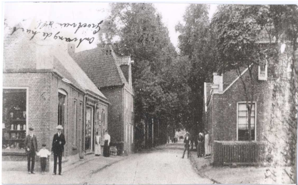
"De Bijenkorf", hier rechts op de foto, het pand waar de Bornsche Courant werd geboren.