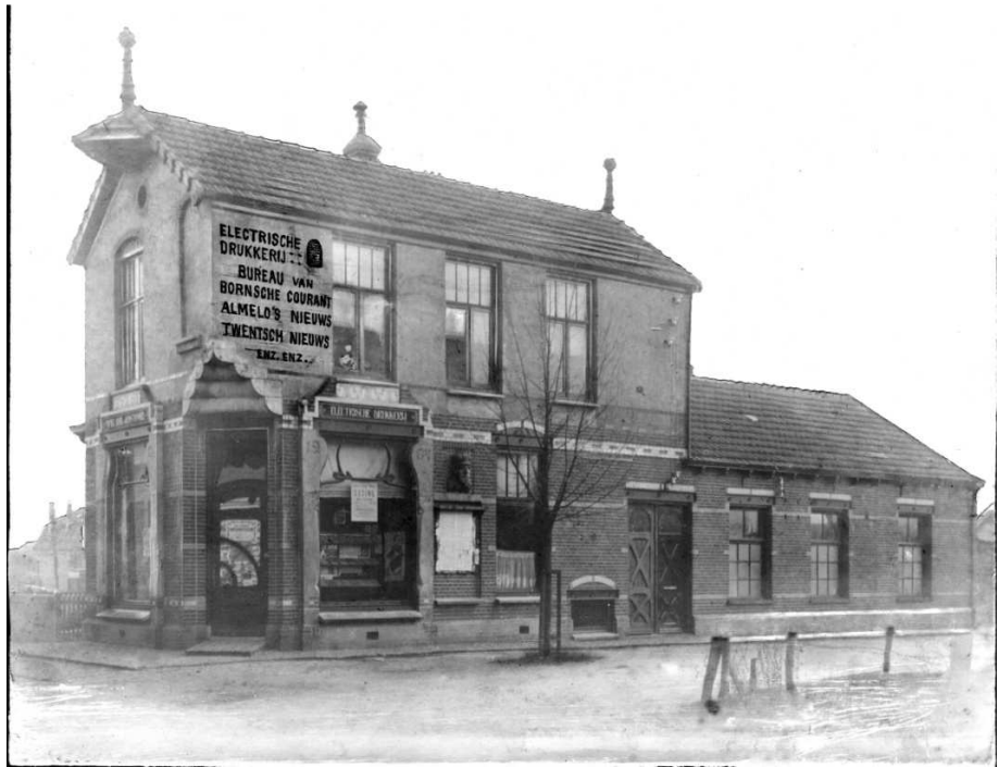
Foto uit 1904 waarop de kantoorboekhandel met drukkerij is te zien. Het achterste deel met de drie ramen is nog steeds te zien aan de Cuba.

“Berichten en geruchten over de voortgang der geallieerde troepen bereikten ons aan het eind der vorige week. Dan hoorden wij van diverse plaatsen in de Geldersche Achterhoek, die reeds bevrijd waren. Den Eersten en Tweeden Paaschdag steeg de spanning met het uur, de Mofen trokken steeds somberder gezichten. Het kanaal bij Delden werd bereikt. Enschede vliegveld, Oldenzaal werd bevrijd. Verlangend keken wij uit naar de eerste tanks, dit des te meer omdat wij Tweeden Paaschdag als straf voor het doodschieten van een Duitscher in huis moesten blijven en wie weet wat voor andere gevolgen deze zg terroristische daad zou hebben evenals enkele andere als het reeds gevangen zetten van Duitse soldaten enz. enz. Een dappere Borne jongen heeft toen kans gezien om naar Oldenzaal te gaan om daar de Engelschen van een en ander te verwittigen. Maandag gingen enkelen