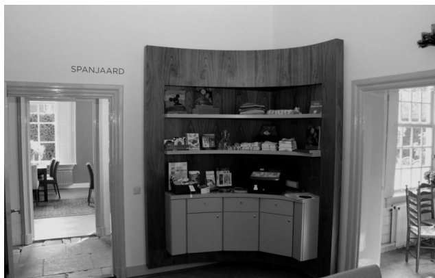
In de tuinkamer is een balie geplaatst voor kassahandelingen en verkoop van souvenirs e.d.

Voor het bestuur blijft de staat van onderhoud van het pand een belangrijk aandachtspunt. Een dergelijk oud pand behoeft constante zorg. In voorgaande jaren is er een plan van aanpak opgesteld waarin prioriteiten zijn aangemerkt. Dit voorjaar is een subsidie aangevraagd voor onderhoud- en herstelwerkzaamheden, deze kan bij toewijzing een deel van de kosten dekken, maar de