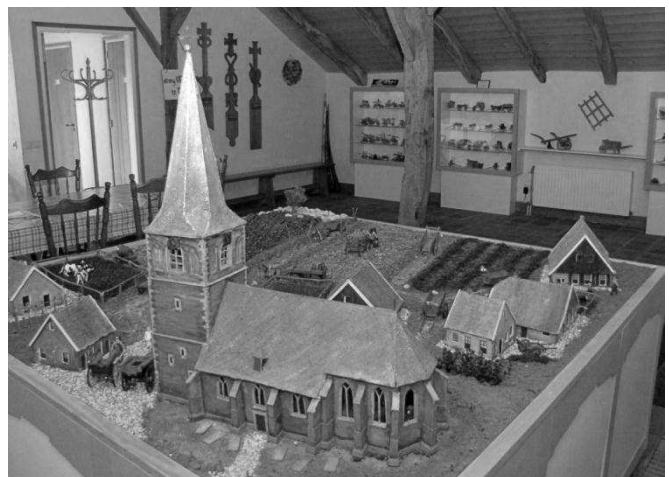
Maquette van de oude kerk met omliggende huizen.