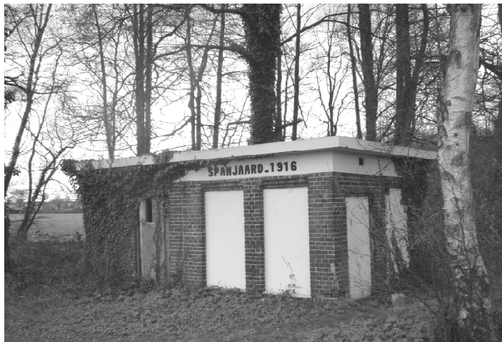
Het pompgebouw van Spanjaard, gefotografeerd in 2010 aan de Piepersveldweg.

Lang niet iedereen had een pomp in de keuken of achter het huis. Afgelegen huizen en boerderijen