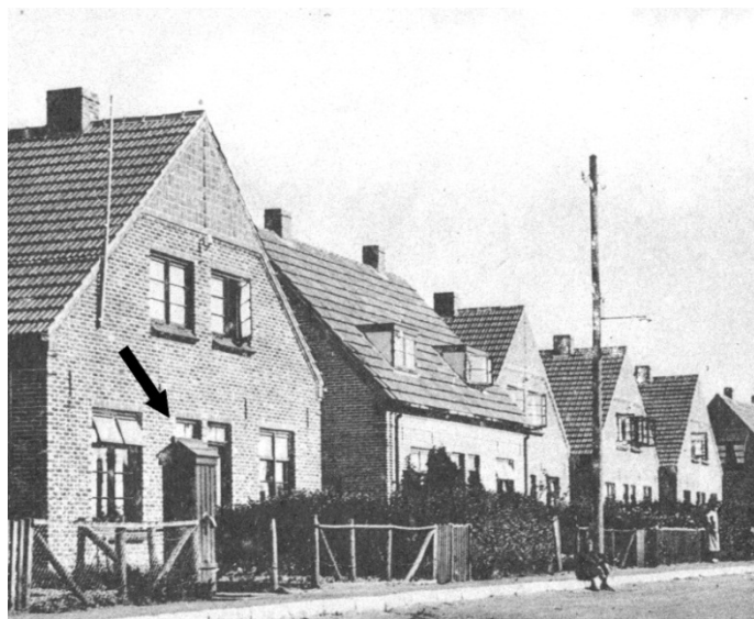
De pijl geeft de plek van de openbare waterpomp aan in de Oude Hengeloseweg

beschikten vaak over een put, soms zelfs over een gezamenlijke put. Op een aantal plekken in het dorp stonden openbare waterpompen, bij voorbeeld in de Wilhelminastraat, in de Deldensestraat ter hoogte van de rode lap, in de Oude Almeloseweg ter hoogte van de voormalige fabriek van Stork, bij de Keizerskroon en in de Oude Hengeloseweg. Over het algemeen was de kwaliteit van het Bornse water slecht en in droge zomers was er soms helemaal geen water.