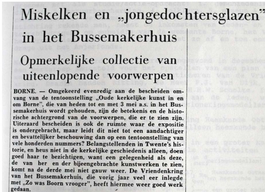
Bericht in de Twentse Courant van 24 april 1964.

Tegenwoordig wordt gekozen voor een dagtrip met een comfortabele touringcar, waarbij de ene keer in Duitsland wordt aangelegd en de andere keer ergens in Nederland. "Zo hebben we al heel wat mooie plekjes bezocht, het oude eiland Schokland met zijn voormalige haven Emmeloord, of Clemenswert met het jachtslot van de bisschop van Munster. Dat waren prachtige excursies om er een paar te noemen".