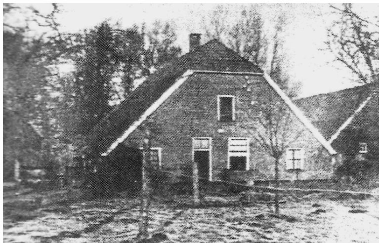
Het Wegtershuis op 't Hesselder (ca. 1920)

Bovenstaand rijmpje heeft, zoals ik in het vorige artikel uiteenzette, betrekking op boerderijen en hun (vroegere) bewoners aangeduid met hun (bij)namen gelegen in de buurtschap het Tusveld, dat tot 2001 deel uitmaakte van de gemeente Borne. In het buurrijmpje zijn bijzonderheden aangegeven over de ligging, respectievelijk het doen en laten van enkele Tusveldbewoners. Het rijm was, zoals gezegd, niet echt helder om te kunnen achterhalen wat er de clou van was.