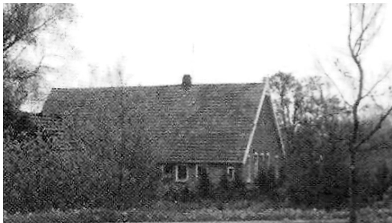
Boerderij "de Fot(te) op 't Hesselder (ca. 1900)