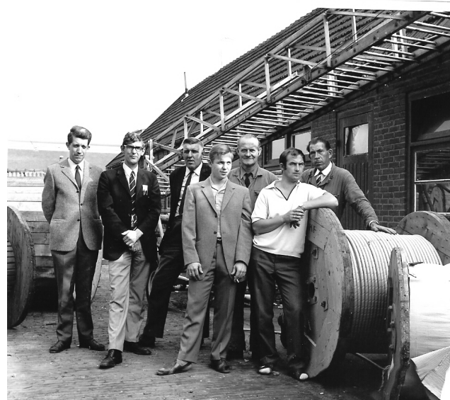
Personeelsleden van het Electriciteitsbedrijf.

In 1968 wordt door de minister van Economische zaken een commissie geïnstalleerd die de doelmatigheid van kleine (locale) elektriciteitsbedrijven in beeld moet brengen en zij zal ook gaan onderzoeken in hoeverre de gemeenten hun rol daarin (distributie en beheer) nog kunnen vervullen. Het college ziet de bui al hangen en opent in 1969 onderhandelingen met de IJsselcentrale.