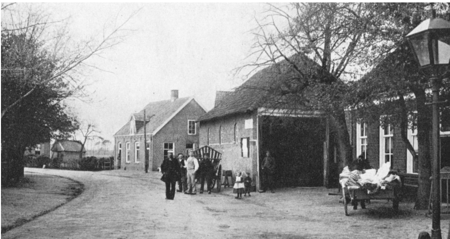
Deze oude ansichtkaart van de Hoofdstraat in Zenderen is gemaakt rond 1909. Geheel rechts de straatlantaarn bij café en logement Haarhuis.

De prijs die geboden wordt, vindt het gemeentebestuur te hoog. Deze is vrijwel gelijk aan de prijs die nu nog berekend wordt door de B.E.M. Daarnaast vindt het gemeentebestuur dat eventuele winsten ten goede moeten komen aan elektriciteitsvoorzieningen in deze gemeente én men wil toezicht kunnen uitoefenen op de gang van zaken. Tevens zijn er een aantal financiële lange termijn risico's verbonden aan het uitgeven van een nieuwe concessie aan de B.E.M. of de IJsselcentrale. De raad besluit daarom op 21 september 1926 de concessie niet te gunnen aan een stroomleveringsbedrijf maar een gemeentelijk elektriciteitsbedrijf op te richten. Uit onderzoek is gebleken dat een dergelijk bedrijf zeer winstgevend is en uit ervaringen van andere kleine gemeenten komt naar voren dat de bedrijfsvoering geen extra kosten met zich mee zal brengen. Behoudens goedkeuring van Gedeputeerde Staten (GS) besluit de raad met ingang van 1 juli 1927 het gemeentelijk Electriciteitsbedrijf op te richten; de bezittingen van de B.E.M. in eigendom over te nemen voor een bedrag van f 25.000,-- , met uitzondering van de hoogspanningskabels, goederen in het magazijn en het leidingnet in Zenderen. Voor de levering van stroom sluit het gemeentebestuur een overeenkomst met het Twentsch Centraal Station uit Hengelo. Het Electriciteitsbedrijf levert de stroom voor de straatverlichting en de huisaansluitingen.