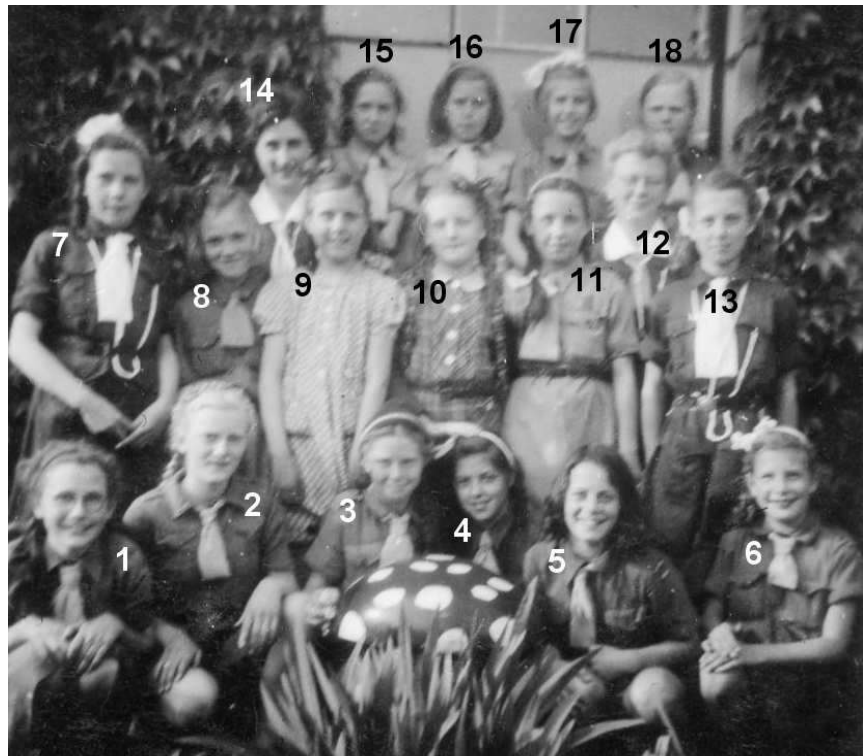
De kabouters van de Afdeling Borne in 1949