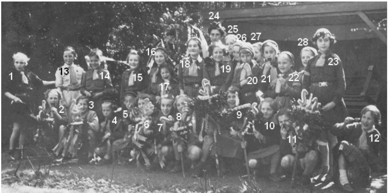
Na de palmpasenoftocht op de foto in de tuin van de zusters