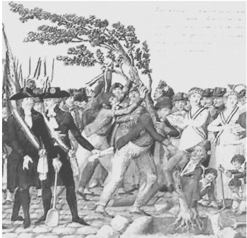
De vrijheidsboom was een veelgebruikt symbool van de vernieuwde maatschappij die bewerkstelligd werd door de Franse Revolutie. Ook stond het symbool voor vergelijkbare omwentelingen in andere landen, zoals de Bataafse Republiek in Nederland.