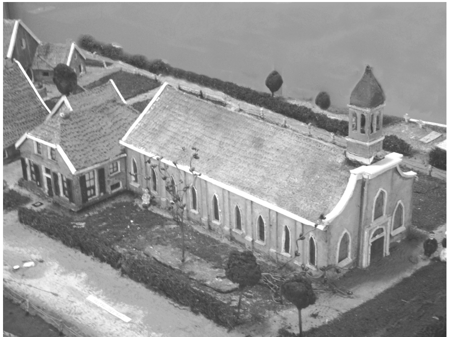
Foto van de maquette van de waterstaatskerk uit 1838 en de pastorie met schuur uit 1786. De kerk is voortgekomen uit de oorspronkelijke schuurkerk van 1786. De pastorie is nog steeds te bewonderen. De maquette is gemaakt op basis van tekeningen in het RK-Parochie-archief.

Rooms-katholieken van Borne gaan in die tijd (vóór 1785) ter kerke op het Groothuis in Hertme of 't Hulscher te Zenderen. Omdat de rooms-katholieken in de tweede helft van de 18 e eeuw wat meer vrijheid kregen voor het beleven van hun geloof en het hen ook oogluikend werd toegestaan eigen kerken te bouwen, ontstaat in het dorp Borne de wens om hier een eigen parochie te stichten en een kerk te bouwen. Wel waren er voorwaarden waaraan zo'n kerk moest voldoen: het gebouw mocht er niet uitzien als een kerk en de ingang mocht ook niet aan de openbare weg liggen. Het meest eenvoudige was de kerk te bouwen als een boerenschuur, vandaar ook de veel gebruikte naam hiervoor: schuurkerk.