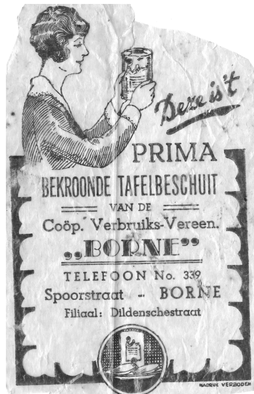
Verpakkingsmateriaal van beschuiten van de Coöp. Verbruiksvereniging "Borne". Let op de taalfout in het etiket.

In de tweede helft van de 19 e eeuw ontstonden veel coöperaties. Het zijn verenigingen die werden opgericht met als doel de leden te beschermen tegen het winstbejag van de detailhandel, het uitkeren van dividend aan de leden en om kwaliteit