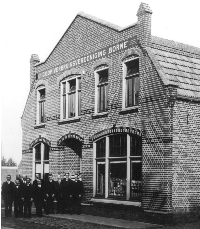
Het pand van de coop. verbruiksvereniging "Borne", zoals ook op de gevel te lezen is, gelegen aan de Stationsstraat 44.

In het jaarverslag over 1916 van de Bornse Kamer van Koophandel staat het volgende vermeld: De vereniging heeft 236 leden. Verkocht worden: roggebread, tarwe- en witte stoeten, margarine en plantenboter, suiker, rijst, gruttenmeel, koffiebonen en zachte zeep. De omzet bedraagt f 72.000,-- , er zijn drie bedienden in dienst.