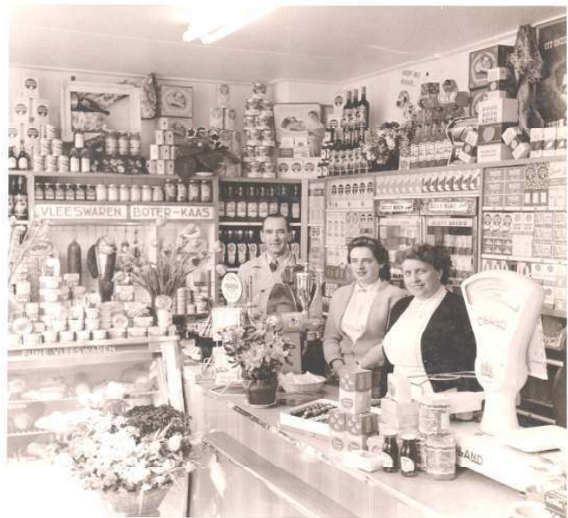
Mijn trotse ouders en zus lens bij de opening van de verbouwde winkel.

helemaal achter in de tuin. Later fietste ik er wel eens op om bestellingen weg te brengen. Met de tong op het derde knoopsgat kwam ik weer thuis: geen doen voor een grietje van elf/twaalf jaar.