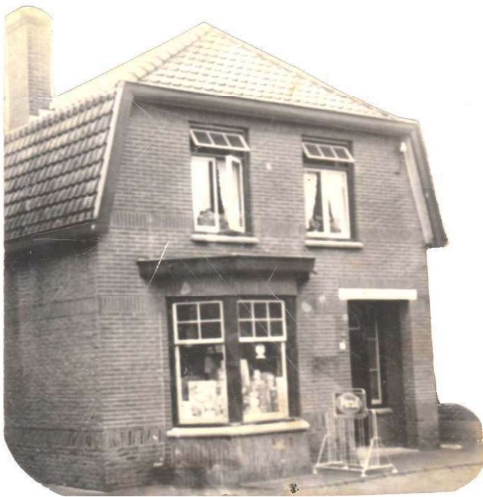
Het woonhuis aan de Tichelweg werd in 1930 voor het eerst ingericht als winkel

Opnieuw zuinig wezen, dit keer stond er een auto boven aan het verlanglijstje. Vader had ooit zijn rijbewijs gehaald, maar dat was ver voor de oorlog. Een opfriscursus bleek geen luxe en toen de spaarpot leeg gehaald werd kon er een tweedehands Ford Taunus worden gekocht. Het moet een enorme verlichting geweest zijn. De bakfiets verhuisde naar het kleine schuurtje