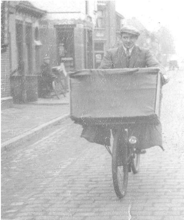
Mijn vader op de transportfiets bezig met bezorgen van de boodschappen in 1930.