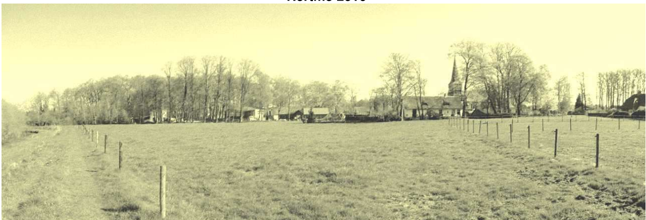
Hertme: de achterzijde van de pastorie met kerk en links het openluchttheater gezien vanaf de Deurningerbeek.