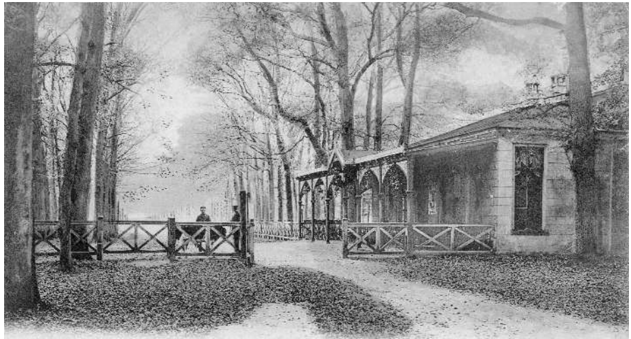
De uitspanning 'het Jagertje' rond 1900

Een echt Twenthsch dorp is Borne nog in menig opzigt althans, al bragt ook hier de laatste halve eeuw belangrijke verandering. Aan nieuwe huizen ontbreekt het geenszins, evenmin als aan spoorwegstation of fabrieksschoonsteenen. Maar in zóóver heeft het zijn oud karakter bewaard, dat het nog altijd een doolhof is van enge, kronkelende straten, en dat er nog in overvloed die oude, groote, voorvaderlijke huizen worden gevonden, zonder