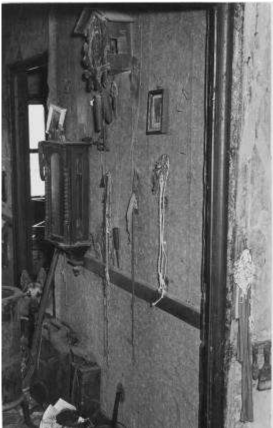
Interieurfoto van de keet genomen vlak voor de afbraak in 1956. Geheel rechtsonder hangen aan haakjes de kwasten nog aan de muur.