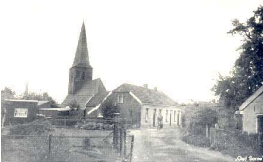
De Pellenhof gezien vanuit de Lijkweg (nu Brinkstraat).