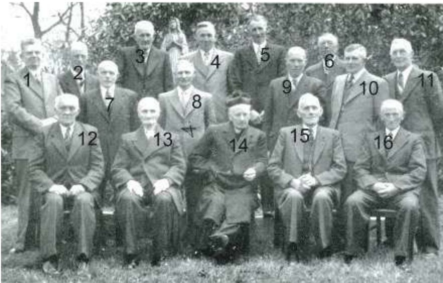
Bestuur en commissarissen van de Concordia, gefotografeerd bij gelegenheid van het 40 jarig jubileum in 1954. Wie kent de namen van deze personen?

De fabriek stond aan de Pastoor Ossestraat 10. Op 16 februari 1914 werd deze in gebruik genomen.