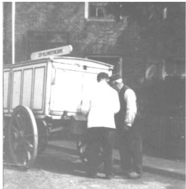
Hendrik Klumpers, met op de achtergrond zijn woning in de Grotestraat, haalt melk bij een onbekende melkventer van de Coöp. Melkinrichting Borne.

Spoedig daarna werd de fabriek, eerst met twee en daarna met drie arbeiders als "handkrachtbedrijf" in bedrijf genomen. Een handkrachtbedrijf, ook wel werkplaats genoemd, was een klein type boterfabriek waarbij alle werktuigen manueel werden aangedreven. De kwaliteit die door deze categorie bedrijven geleverd werd, was minder constant dan van de toen steeds meer in zwang zijnde stoomzuivelfabrieken. Het bedrijf van de gebroeders Koning was voor die tijd dus heel modern. Waren de verenigde boeren financieel niet in staat om de inventaris van Koning over te nemen?