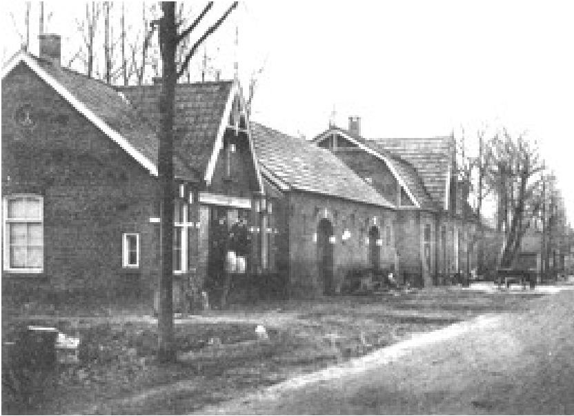
Links de Eendracht, ernaast schuur van Scheuten en vervolgens het café van G.J. Winkelman. Nog net zichtbaar: op het laadplatform staan twee mannen met twee tonnetjes boter.

Om tolgeld uit te sparen hadden ze een oplossing bedacht. Er werd nog een fabriek gebouwd: de Eendracht. Deze bediende de boeren uit Hertme en de Hoop uit het gebied ten noorden van Zenderen. Beiden waren hand-krachtbedrijven.