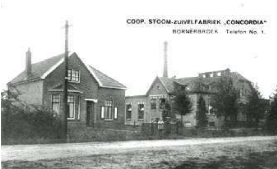
De Concordia rond 1920

Aankankelijk werd alleen boter gemaakt, de ondermelk en de karnemelk gingen terug naar de boerderij. Een aantal jaren later is gestart met de verkoop van consumptiemelk. Deze situatie duurde voort tot 1953. Vanaf dat jaar wordt de melkverkoop voor gezamenlijke rekening verzorgd door de Coöperatieve Melkinrichting Hengelo. In 1954 wordt in de fabriek boter, kaas en melk verwerkt. Voor zover nodig wordt melk geleverd aan "het westen" en voor industriële verwerking.