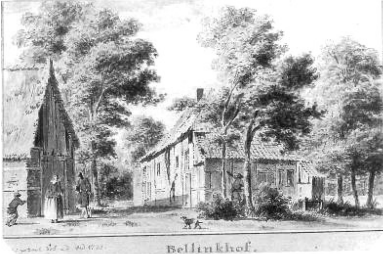
"Het Bellinkhof": gewassen pentekening van Cornelis Pronk uit 1732